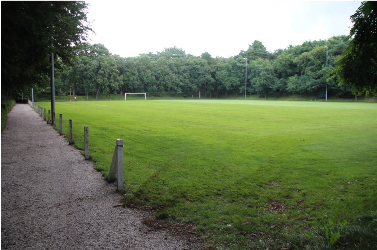
Figuur 4. Het voetbalveld dat sinds 1953 (64 jaar) aanwezig is op landgoed Duyngheest. Afbeelding betreft de situatie aanwezig op maandag 21 augustus 2017.

Tijdens het overleg met provincie Zuid-Holland kwam dit punt aanbod en werd aangegeven dat men niet weet hoe dit nu tot stand is gekomen en dat dit dient te worden uitgezocht. Voor nu geldt echter dat de initiatiefnemers in principe een natuurdoeltype moet compenseren op landgoed Duyngheest, terwijl het al 64 jaar een voetbalveld is.