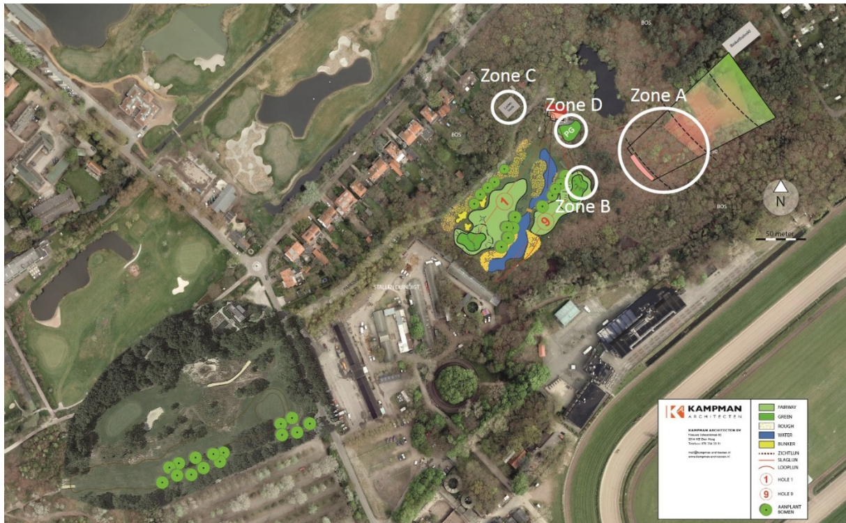
Figuur 3. Voorgenomen ontwikkeling op landgoed Duyngeest Zones A, B, C en D zijn wit omcirkeld. Zone D ligt direct naast het clubhuis (deels tuin) waar een chipping/putting green wordt aangelegd. Hiervoor worden twee zomereiken gekapt.

Voor de aanleg van de driving range (zone A), hole 9 (zone B) en de lockerloods (zone C), zie figuur 3, worden bomen gekapt en gaat het respectievelijk om de volgende oppervlakten 1200 m 2 (40m x 30m), 80 m 2 (20m x 4m) en 120 m 2 (10m x 12m). Provincie Zuid-Holland wilde weten om welk percentage dit gaat ten opzichte van het totale oppervlak van het landgoed en ten opzichte van het totale aanwezige duinbos op het landgoed. Figuur 3 geeft de globale ligging weer van zone A, B en C. Deze is geprojecteerd op de voorgenomen ontwikkeling van het voetbalveld en de directe omgeving.