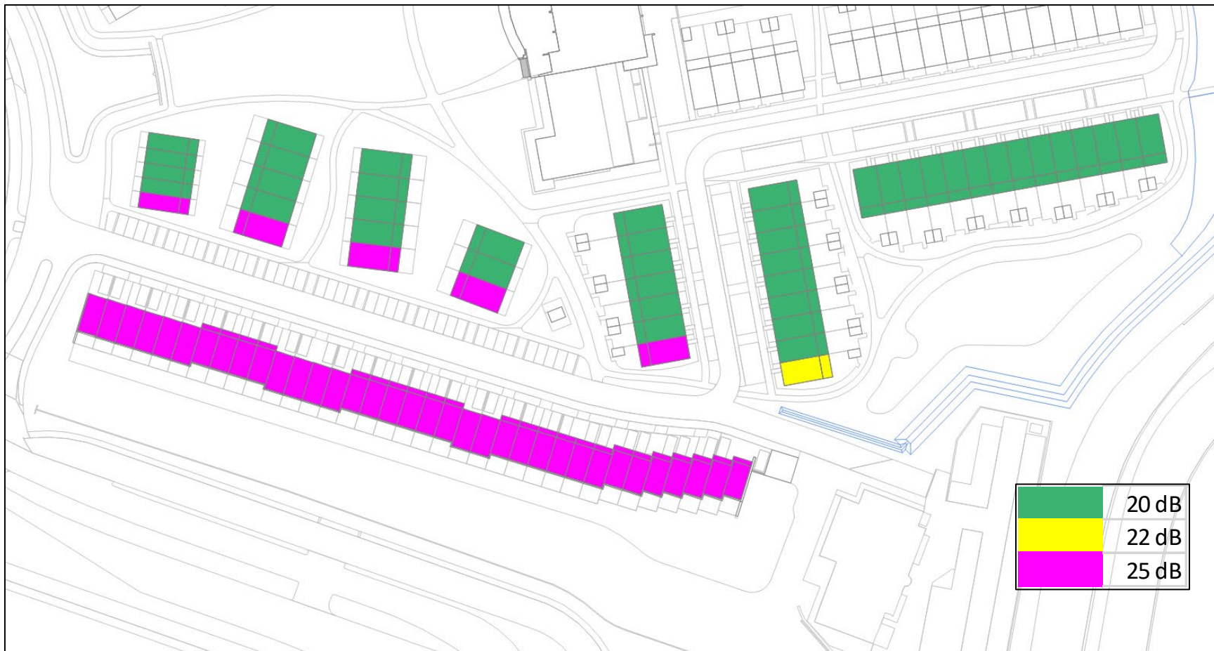
Afbeelding 2 Minimaal vereiste geluidwering van de gevel aan zijde ontsluitingsweg van/naar in het plangebied gelegen hotel