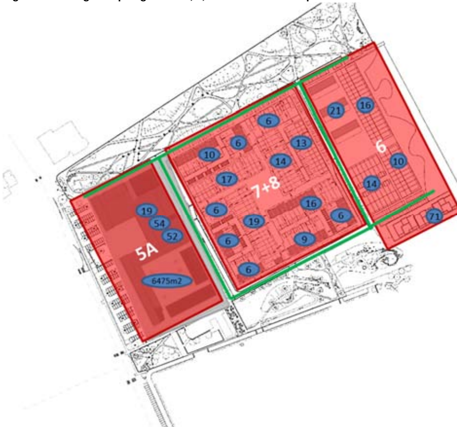
Figuur 2: woningen in plangebied 5a, 6, 7 en 8 van Babberspolder-Oost