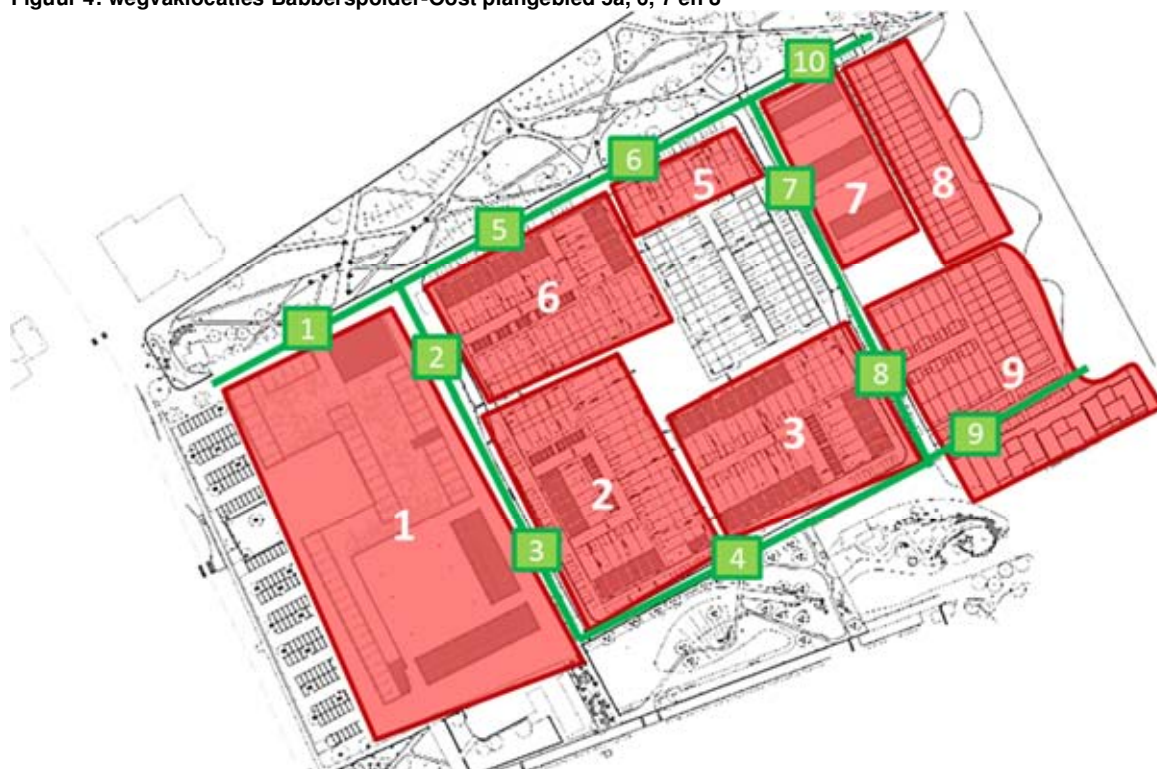
Figuur 4: wegvaklocaties Babberspolder-Oost plangebied 5a, 6, 7 en 8