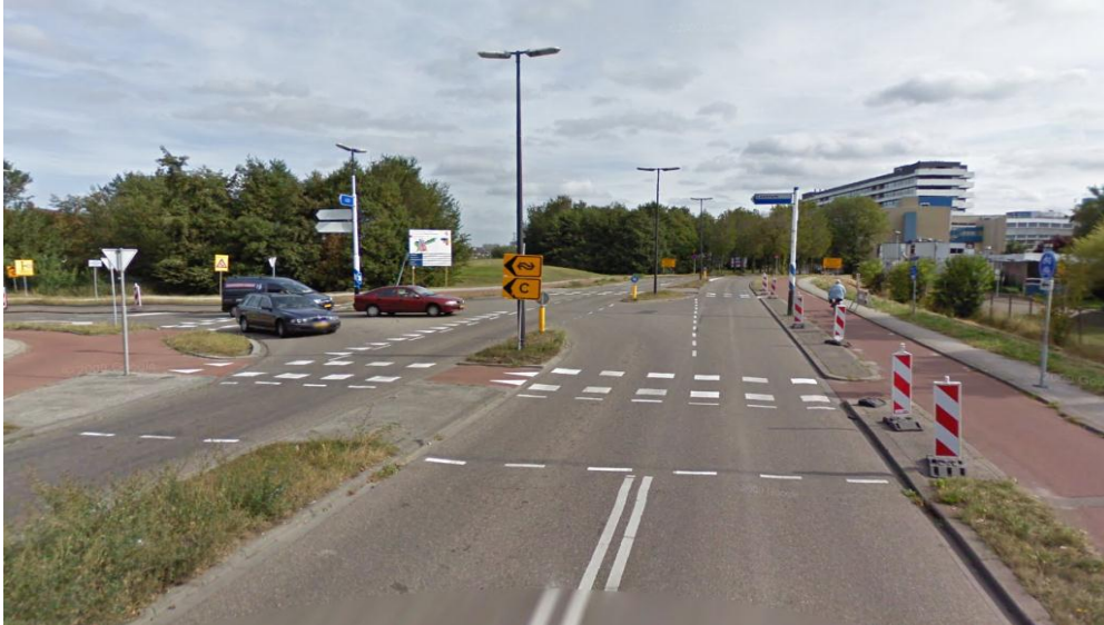
Foto: Fietsoversteekvoorziening Deltaweg

De gebiedsontsluitingswegen, zoals de Marathonweg en Deltaweg, kennen vele gelijkvloerse oversteekvoorzieningen en vormen barrières voor langzaam verkeer. Om de verkeersveiligheid en de oversteekbaarheid van de gebiedsontsluitingswegen voor langzaam verkeer te kunnen blijven garanderen dienen de verkeersintensiteiten op de gebiedsontsluitingswegen niet teveel toe te nemen. Nieuwvestiging van bedrijven die zeer veel goederenverkeer kunnen aantrekken wordt mede om die reden niet wenselijk geacht.