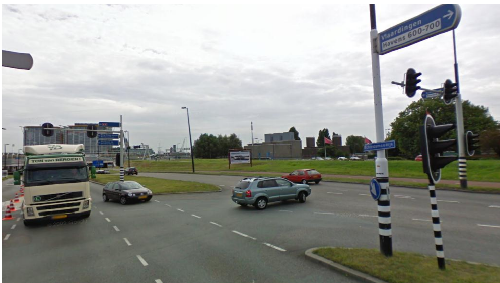
Foto: Schiedamsedijk ter hoogte aansluiting A4

De bereikbaarheid is in gevaar komen door capaciteitsgebrek op met name de kruisingen van wegen en toe- en afritten van de rijkswegen. Het is daarom van belang om bij de vaststelling van ruimtelijke besluiten, zoals het onderhavige bestemmingsplan, de mobiliteitseffecten van ontwikkelingen mee te wegen, teneinde de negatieve effecten van verkeersstromen te beperken. Dit is met name belangrijk als de aan- en afvoerwegen via de bestaande bebouwde kom (met aanliggende woonwijken) voeren en de afstanden naar het rijkswegennet groter zijn dan 1 kilometer. Hiervan is in de onderhavige situatie sprake; de betreffende afstand bedraagt ongeveer 2 kilometer. Mede met het oog op de bereikbaarheid en verkeersafwikkeling is ervoor gekozen om nieuwvestiging van bedrijven die potentieel zeer veel goederenverkeer aantrekken in principe niet toe te staan in het bestemmingsplan.