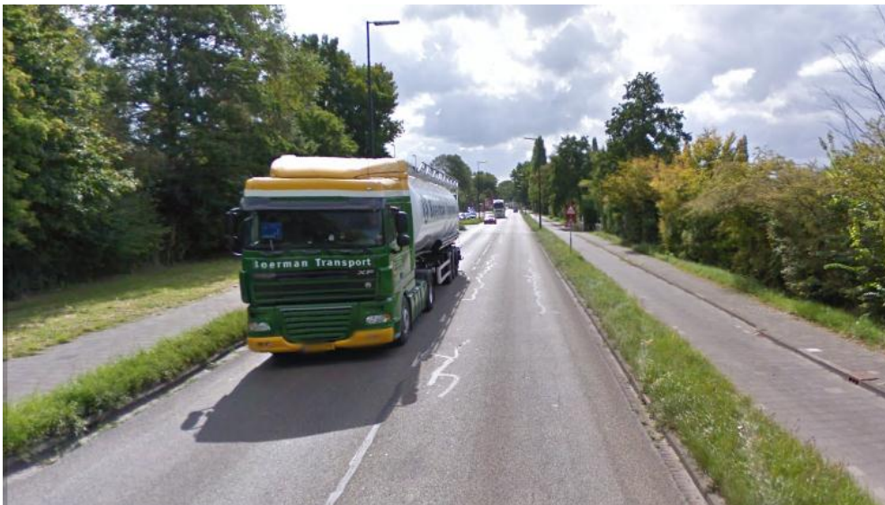
Foto: Vrachtverkeer op Marathonweg

Verkeer en vervoer zorgen ervoor dat bedrijven kunnen functioneren en goederen en mensen van A naar B komen. Voor een bedrijventerrein is de aanwezigheid van goede ontsluitingsmogelijkheden dan ook een essentiële voorwaarde. Verkeer en vervoer kunnen echter ook zorgen voor verslechtering van de verkeersafwikkeling, voor verkeersonveiligheid en voor aantasting van de leefomgeving (geluidhinder, luchtvervuiling en trillingen). Indien teveel verkeer en met name teveel zwaar verkeer (goederenverkeer) wordt gegenereerd, kan dit gevolgen hebben voor de bereikbaarheid, de verkeersveiligheid en de leefomgeving. In het door de gemeente vastgestelde Gemeentelijk Verkeer- en Vervoer Plan (GVVP) wordt ingezet op 'kwaliteit in bereikbaarheid'. Groei van de automobilititeit moet kunnen, maar dient te worden opgevangen binnen de grenzen van leefbaarheid en veiligheid. Het ongebreideld toelaten van sterk verkeersaantrekkende bedrijvigheid is dan ook ongewenst.