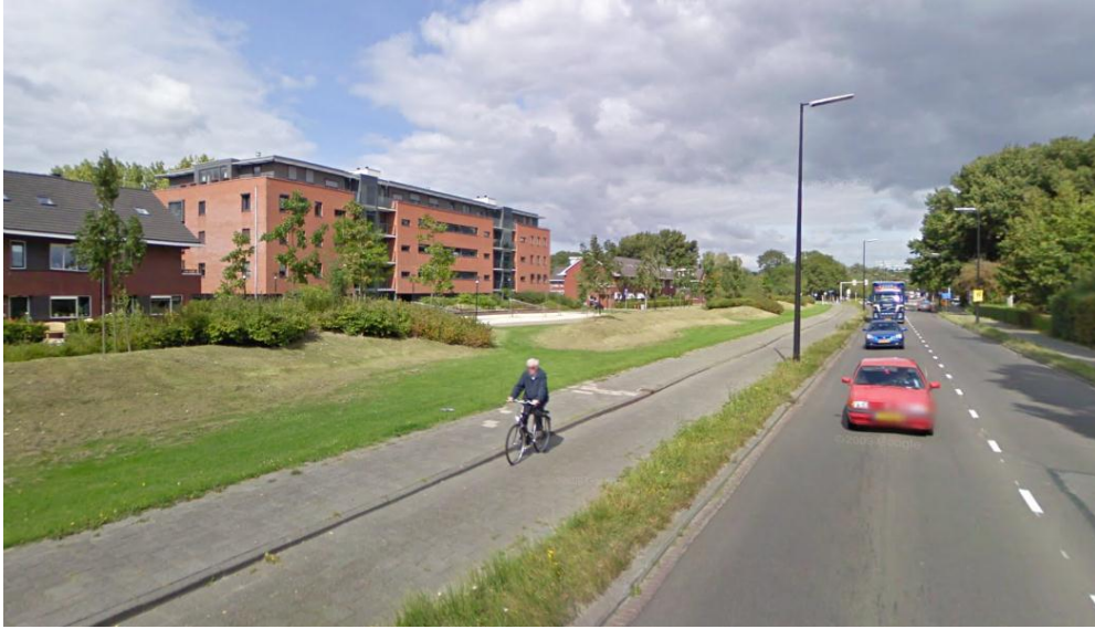
Foto: Woonwijk langs Marathonweg