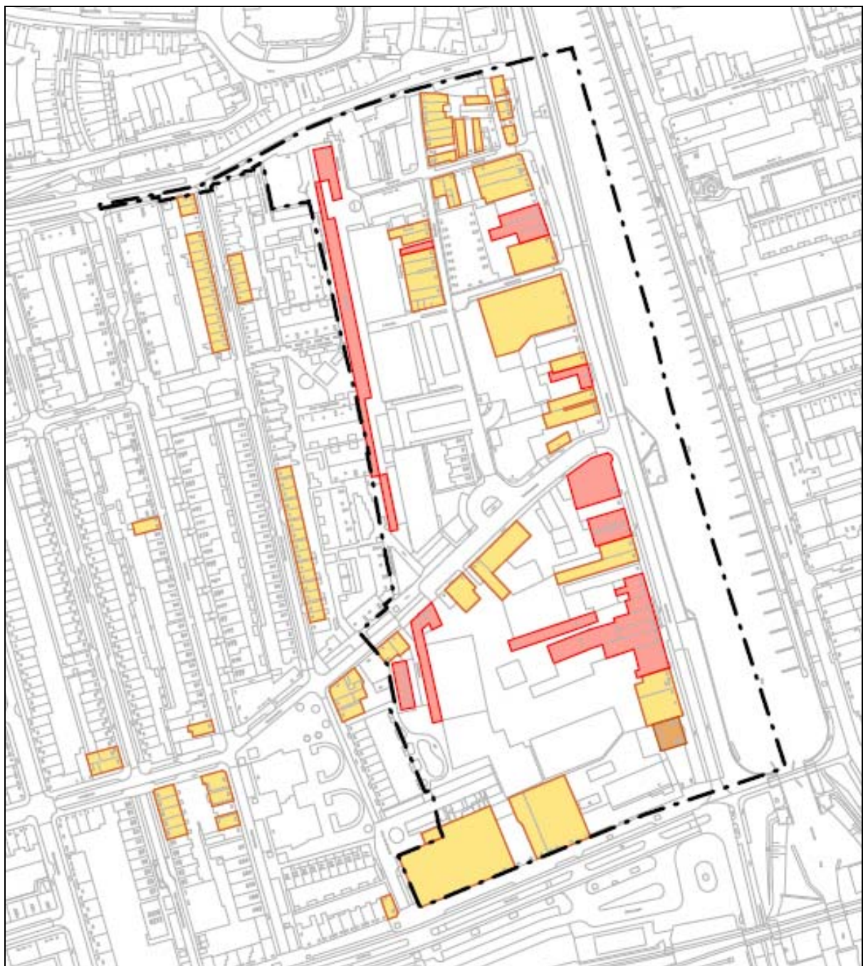
Tabel 2 Overzicht cultuurhistorisch waardevolle objecten

(rood=rijksmonument, oranje=gemeentelijk monument, geel= karakteristiek / beeldbepalend pand)