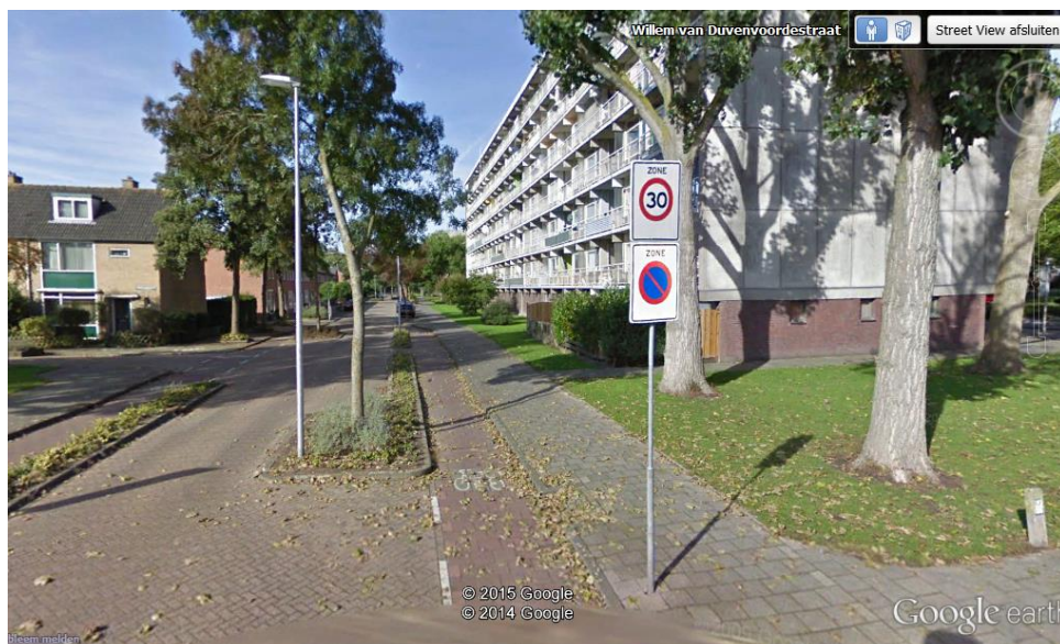
Hoekenstraat gezien vanaf de W. van Duvendoorstraat.

De gemeente deelt de zorgen voor de verkeersveiligheid van reclamanten. Bij de beoogde herinrichting van de westelijk deel van de Hoekenstraat tot zogenoemde fietsstraat – dit mede ten behoeve van de nieuwe fietsroute tussen het centrum van Vianen en het nieuwe woongebied Hoef en Haag – zal de verkeersveiligheid extra aandacht krijgen. De herinrichting aldaar voorziet in een profiel bestaande uit twee rode "rijlopers" van 2 meter breed met daartussen een bolgestrate midden-geleider van 0,5 m breed wordt de automobilist duidelijk gemaakt dat hij feitelijk te gast is en welkom op een fietspad en achter de fietsers moet blijven rijden. Om conflicten tussen fietsers en langs-parkeerders te vermijden wordt er bovendien tussen de rode rij-loper en de parkeerstrook een 0,5 m brede rabatstrook aangelegd (zie ook het raadsbesluit van 1-10-2014 inzake de Realisatie van verkeersmaatregelen in De Hagen en aanleg van de Berchmansweg met rotonde). Uiteraard zal de buurt te zijner tijd worden betrokken bij de beoogde herinrichting.