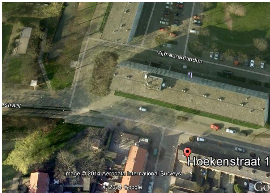
Luchtfoto Google Earth met Hoekenstraat 1.

Reclamanten wonen op Hoekenstraat 1 schuin tegenover de beoogde nieuwe woontoren.