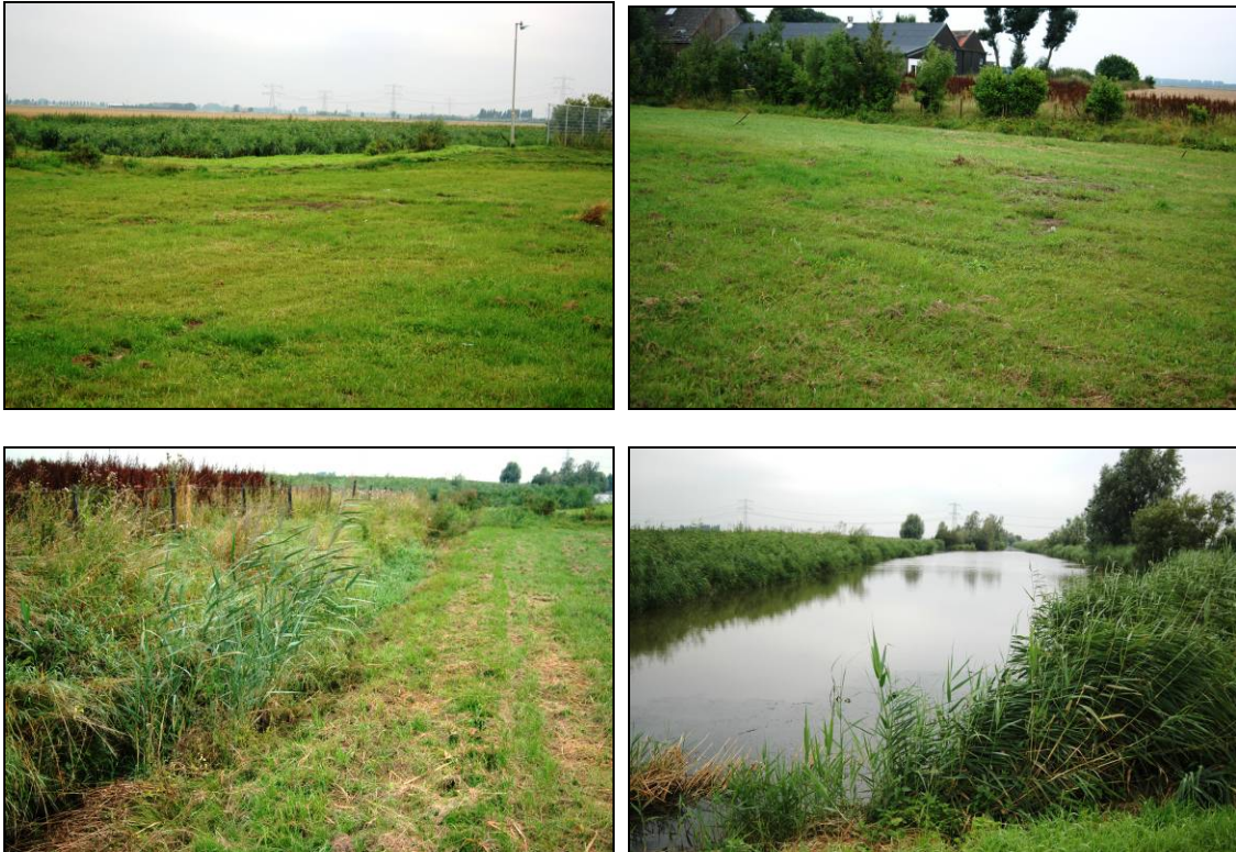
Figuur 2. Beeld van de uitbreidingslocatie te Mookhoek (bovenste foto's) aangrenzende greppel (foto linksonder) en nabijgelegen kanaal (foto rechtsonder).