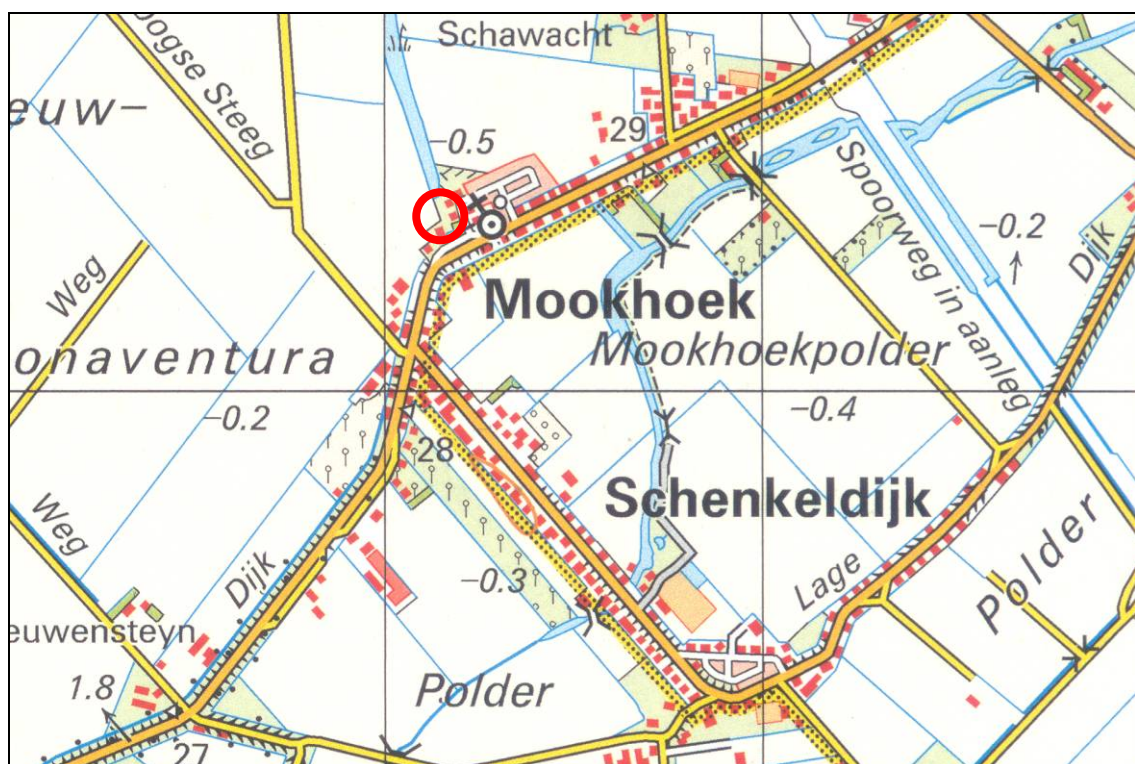
Figuur 1. Globale ligging van de uitbreidingslocatie te Mookhoek.

Er is het voornemen voor een uitbreidingslocatie aan de westzijde van Mookhoek te Strijen. Deze verandering kan negatief zijn voor beschermde planten- en diersoorten. Op basis van beschikbare bronnen is ingeschat dat de beschermde vissoort kleine modderkruiper kan voorkomen. Op grond hiervan heeft RBOI te Rotterdam, die de ruimtelijke procedure begeleidt, aan Adviesbureau Mertens BV te Wageningen verzocht om deze soort in beeld te brengen. Voor RBOI is het dan mogelijk om bij de planontwikkeling rekening te houden met deze soort als die voorkomt en om te bepalen of er effecten gaan ontstaan. In onderhavig rapport wordt verslag gedaan van een veldinventarisatie naar kleine modderkruiper.