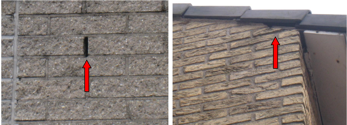
Figuur 4. Voorbeelden van potentiële verblijfplaatsen van vleermuizen in het plangebied De Hooghe Heerlyckheid te Rhoon.