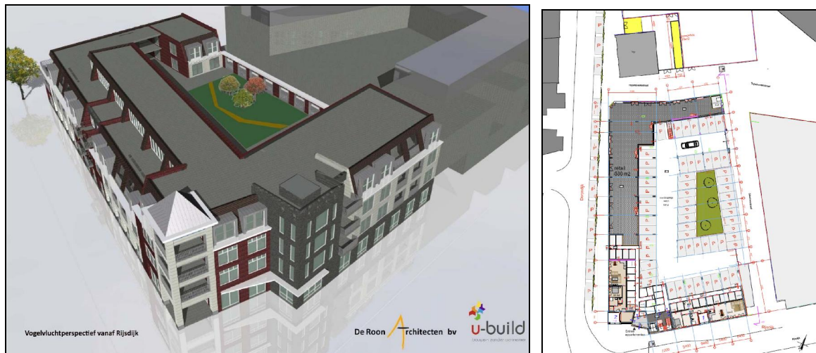
Figuur 3. Impressie van de plansituatie De Hooghe Heerlyckheid te Rhoon.