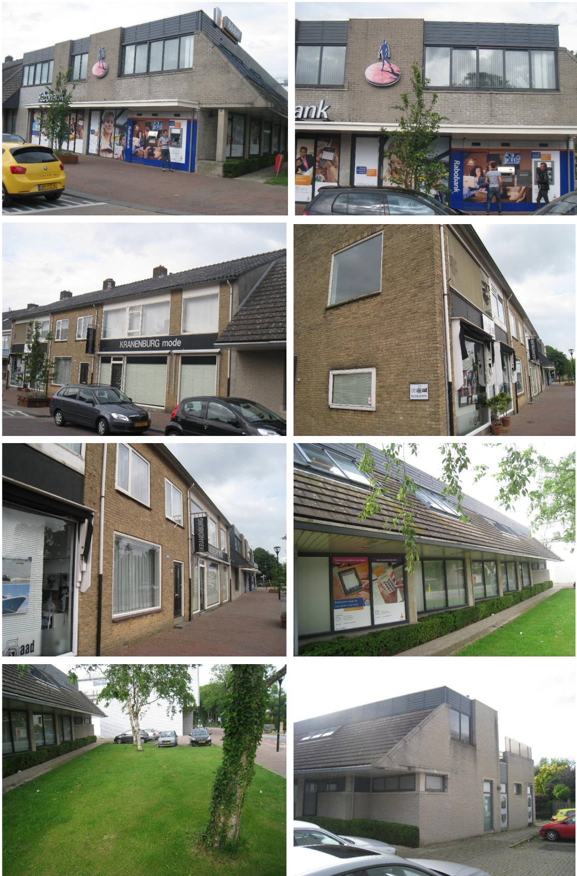
Figuur 2. Aanzicht van het plangebied De Hooghe Heerlyckheid te Rhoon.