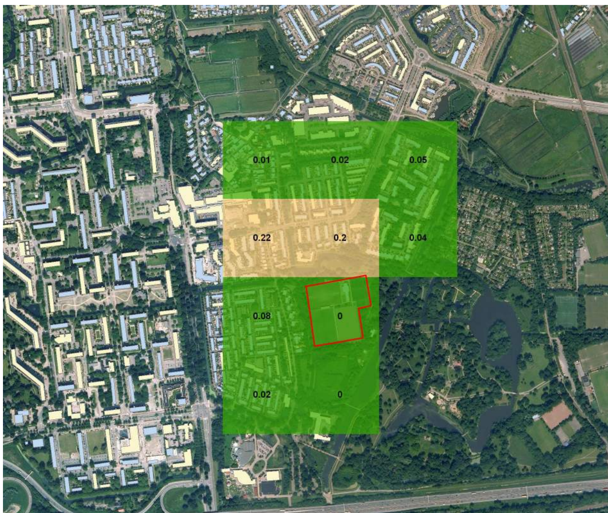
Afbeelding 3 rekenresultaat huidige situatie

Uit de afbeelding blijkt dat er in de huidige situatie geen sprake is van een groepsrisico in het kavel waar het plangebied is gelegen.