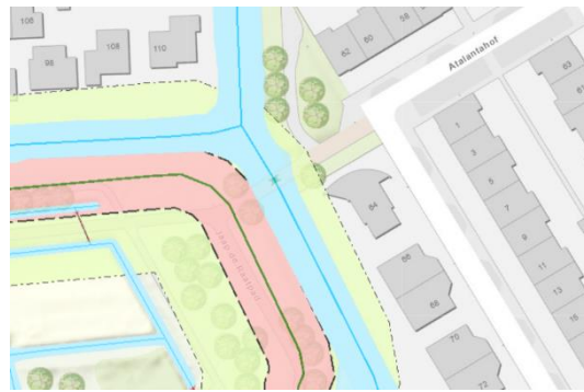
2 Spaland en Kethel

Voor meer informatie of vragen kunt u zich wenden tot de contactpersoon, vermeld onderaan het voorblad van deze brief.