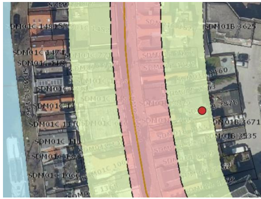
1 Roosbeek 20 en 24