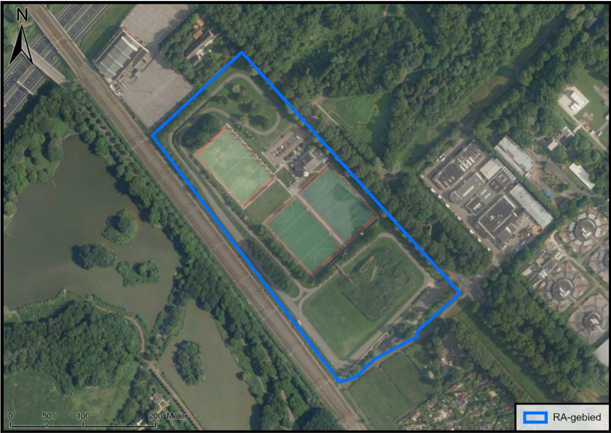
Figuur 2. Weergave van het RA-gebied in de huidige topografie.

Uit een eerder vooronderzoek van Saricon uit 2011, genaamd Masterplan Rijswijk-Zuid met kenmerk 11S082, blijkt dat in de uiterste noordwestelijke rand van het RA-gebied tijdens de Duitse bezetting een loopgraaf en wapenopstelling waren aangelegd.