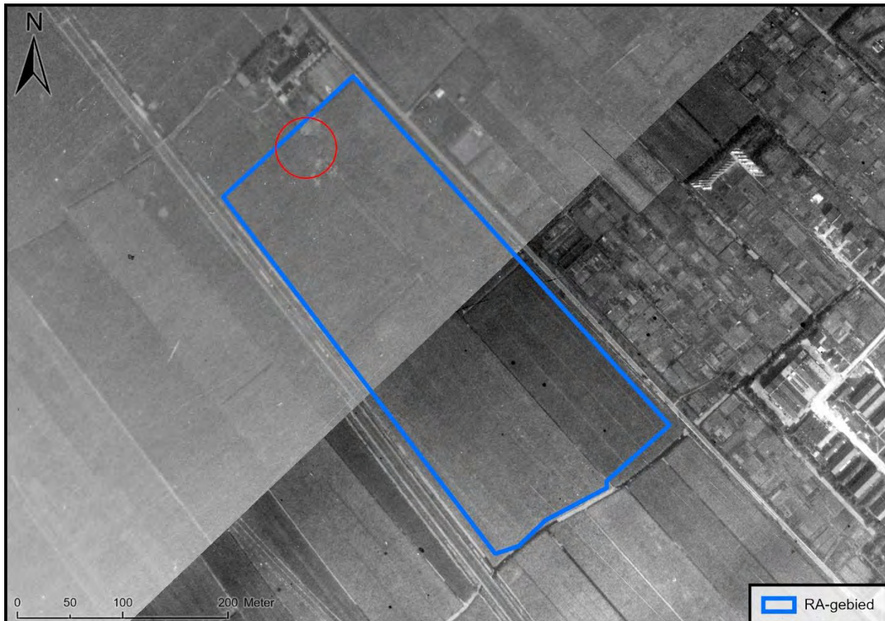
Figuur 5. Op deze luchtfoto van 3 september 1945 is te zien dat de wapenopstelling verdwenen is.

Op een luchtfoto van 3 september 1945, enkele maanden na de bevrijding, blijkt dat de wapenopstelling geheel verdwenen is.