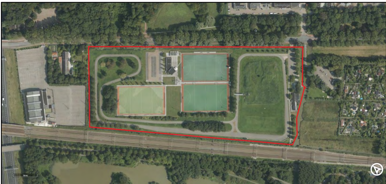
Figuur 1. Begrenzing onderzoeksgebied, zoals aangeleverd door de opdrachtgever.

Saricon heeft in opdracht van Begeleiding en Advies Sportterreinen een beknopte risicoanalyse (RA) uitgevoerd vanwege de aanwezigheid van een Duitse loopgraaf en een wapenopstelling tijdens de Tweede Wereldoorlog binnen de grenzen van het project 'herstructureren sportpark Elsenburg aan de Lange Kleiweg 106 in Rijswijk'.