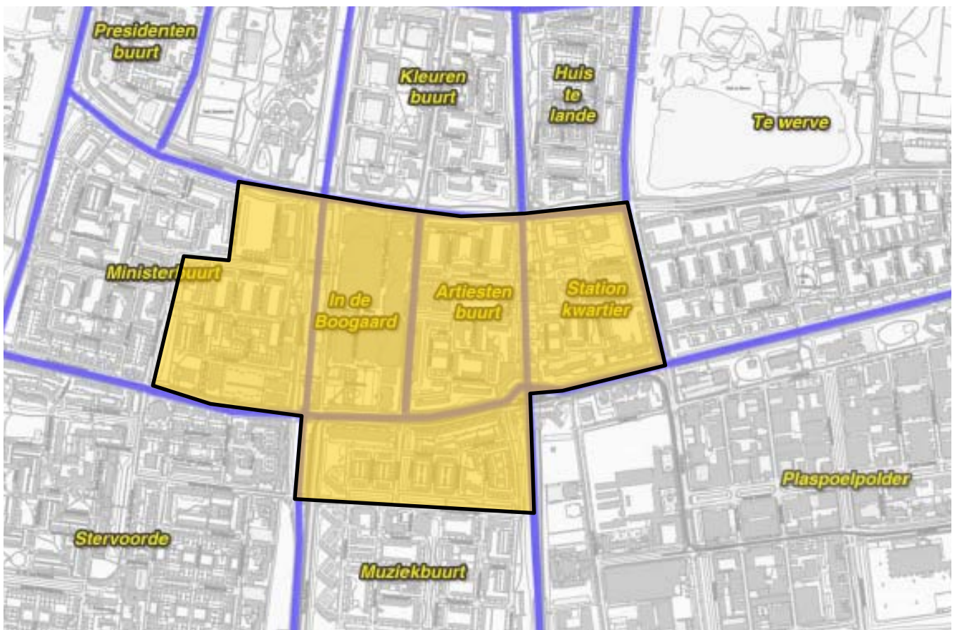
Figuur 1: afbakening stationsomgeving/In de Bogaard

Het gebied stationsomgeving/In de Bogaard omvat het gebied gelegen tussen de Generaal Spoorlaan, de as van de Huis te Landelaan, de as van de Sir Winston Churchilllaan, het Generaal Eisenhowerplein, de Klaroenstraat, de as van de Admiraal Helfrichsingel, de as van de Prinses Beatrixlaan, de as van de Sir Winston Churchilllaan, de oostzijde van de Prinses Margrietsingel, de zuidzijde van de Prinses Irenelaan en de as van de Minister van de Tempellaan. In dit gebied liggen winkels en openbaar vervoervoorzieningen (tram 17, verschillende buslijnen, NS-station Rijswijk) binnen een straal van 500 meter van de woningen.