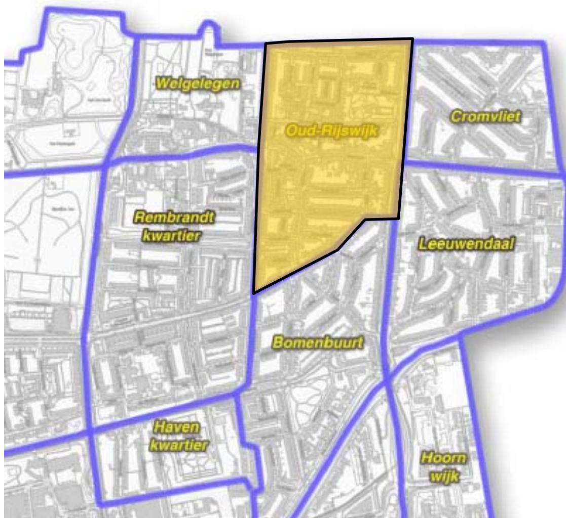
Figuur 2: afbakening Oud Rijswijk

Oud Rijswijk kenmerkt zich als een gebied waar voorzieningen in de directe omgeving van de woningen liggen. In de omgeving liggen openbaar vervoervoorzieningen die rechtstreekse verbindingen hebben met NS stations in Den Haag, Rijswijk en Voorburg. Het gebied wordt begrensd door: de gemeentegrens met Den Haag, de as van de Haagweg, de as van de Lindelaan, de as van de Rembrandtkade, het Ruysdaelplein, de as van de Steenlaan.