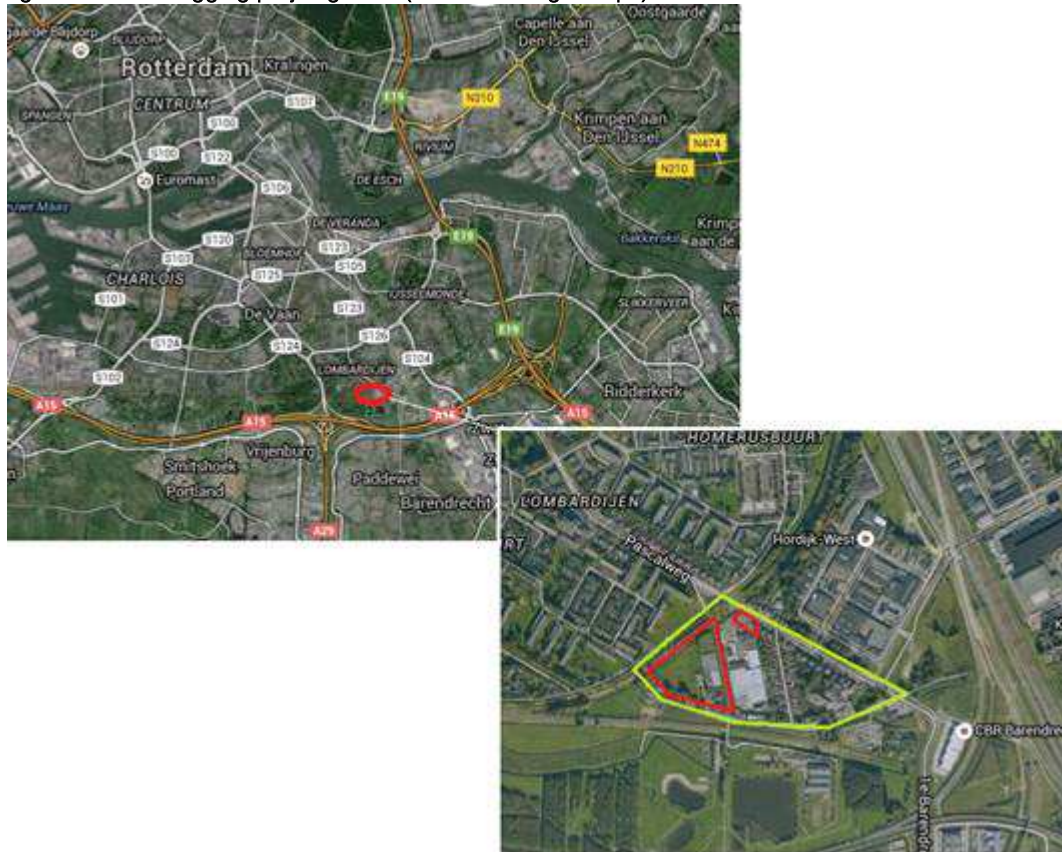
figuur 1. Globale ligging projectgebied (uitsnede Google Maps)

In onderstaande verbeelding van het vigerend bestemmingsplan is de projectlocatie met heel licht geel weergegeven. Het gaat dus in totaal om een zestal woonblokken. Het water dat op deze kaart staat aangegeven is inmiddels al gerealiseerd.