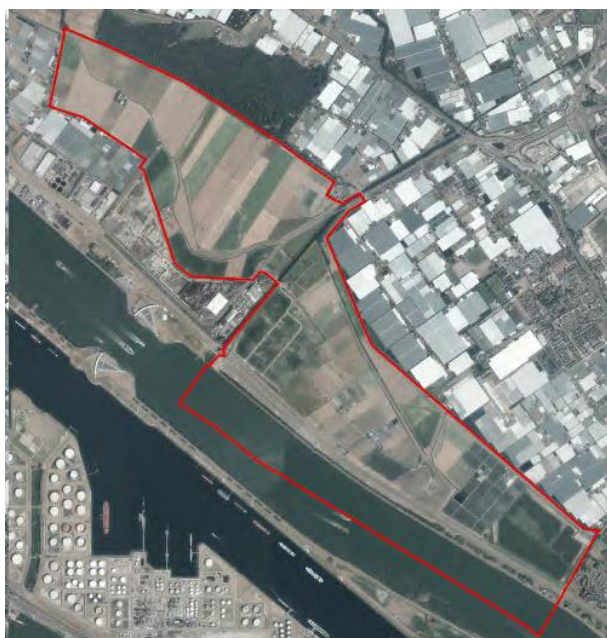
Figuur: ligging plangebied

Het plangebied Oranjebonnen bestaat uit 550 hectare agrarische grond in de Bonnenpolder en de Oranjebuitenpolder te Hoek van Holland. Het plangebied ligt ingesloten tussen de kassen van het Westland rondom Maasdijk, de woonbebouwing van Maassluis, de Nieuwe Waterweg, het kassengebied langs de Haakweg en de Dwarshaak en het Staelduinse Bos. De plangrens is gewijzigd naar aanleiding van de wijziging in perceel Bonnenweg 30. Zie paragraaf over wijzigingen in ontwikkelingen t.o.v. ontwerp bestemmingsplan.