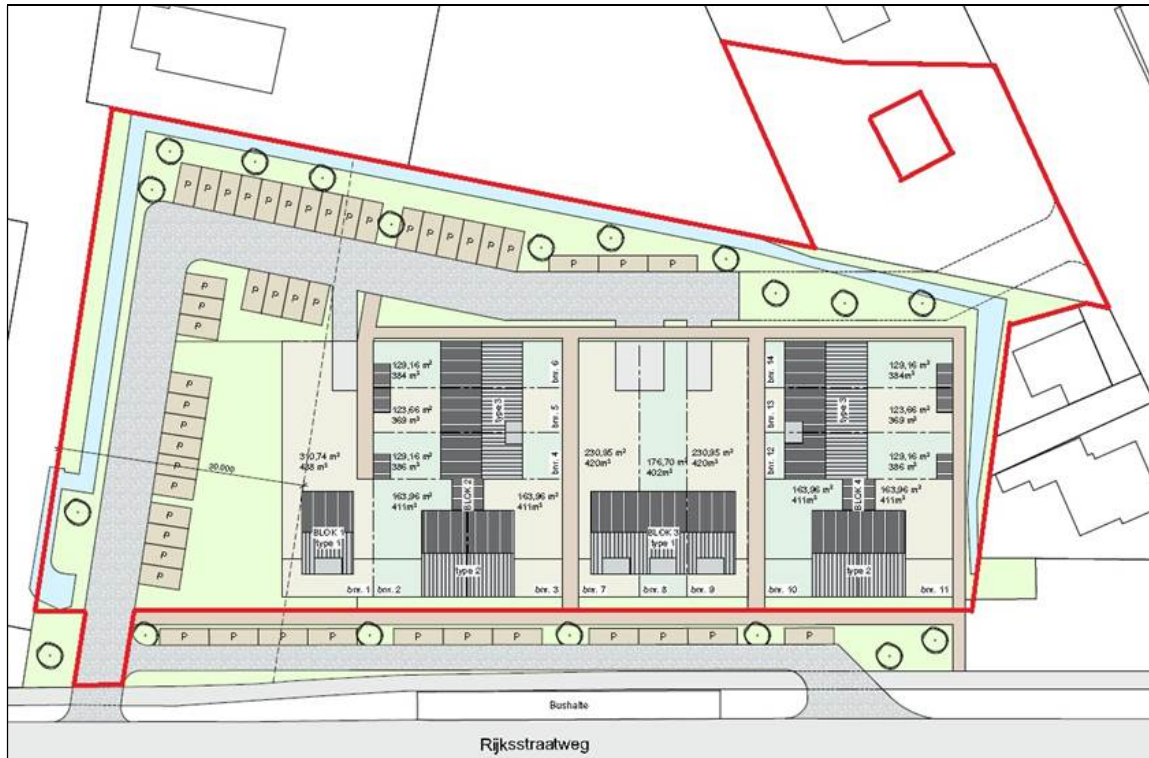
Figuur 3. Impressie van de plannen van hoek Rijksstraatweg - Lagendijk te Rijsoord.