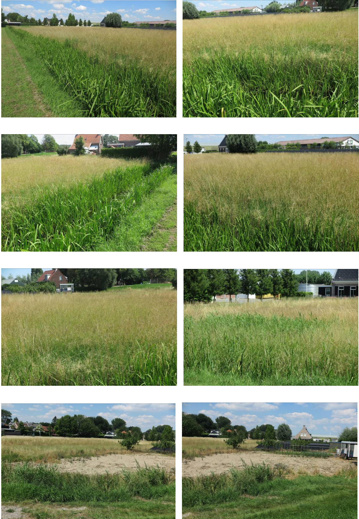
Figuur 2. Foto-impressie van het plangebied in de hoek Rijksstraatweg - Lagendijk te Rijsoord.