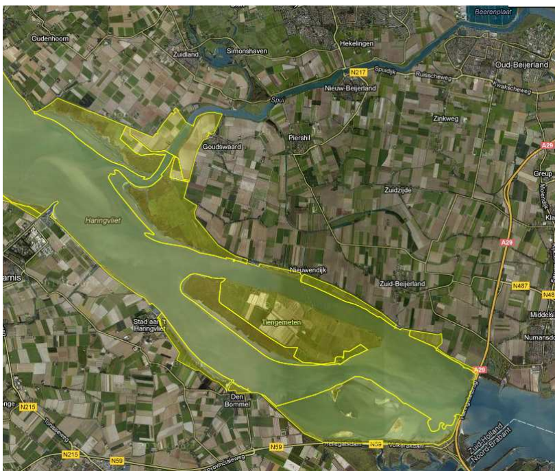
Figuur 1 begrenzing Natura 2000 gebied Haringvliet ter hoogte van het plangebied

Deels in het plangebied, dan wel hier direct aan grenzend, ligt het Natura 2000-gebied Haringvliet met de status van Vogel- en Habitatrichtlijngebied. Daarnaast liggen in de omgeving de Natura 2000 gebieden Hollands Diep (ca. 1,5 km afstand), Oude Maas (ca. 1,5 km afstand), Krammer-Volkerak (ca. 2,5 km afstand) en Oudeland van Strijen (ca. 4 km afstand). Omdat de ontwikkelingsmogelijkheden in het bestemmingsplan dusdanig van aard zijn en de kwalificerende soorten in deze gebieden ver buiten de verstoringafstand liggen voor geluid en licht, worden ze in deze beoordeling niet meegenomen. Dat geldt ook voor de eventuele stikstofeffecten die uit het plan voortvloeien. Er komen geen (stikstofgevoelige) habitattypen in de betreffende Natura 2000 gebieden binnen de invloedssfeer van de verwachte ontwikkelingen van het bestemmingsplan voor.