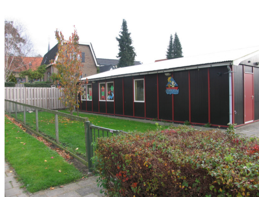
Afbeelding 2: Impressie van de plangebieden. Goed onderhouden en intensief gebruikt plangebieden, met weinig ruimte voor beschermde soorten. De eerste 5 foto's tonen plangebied 1, de laatste foto (rechtsonder) toont plangebied 2(Foto's: SAB, 2011).