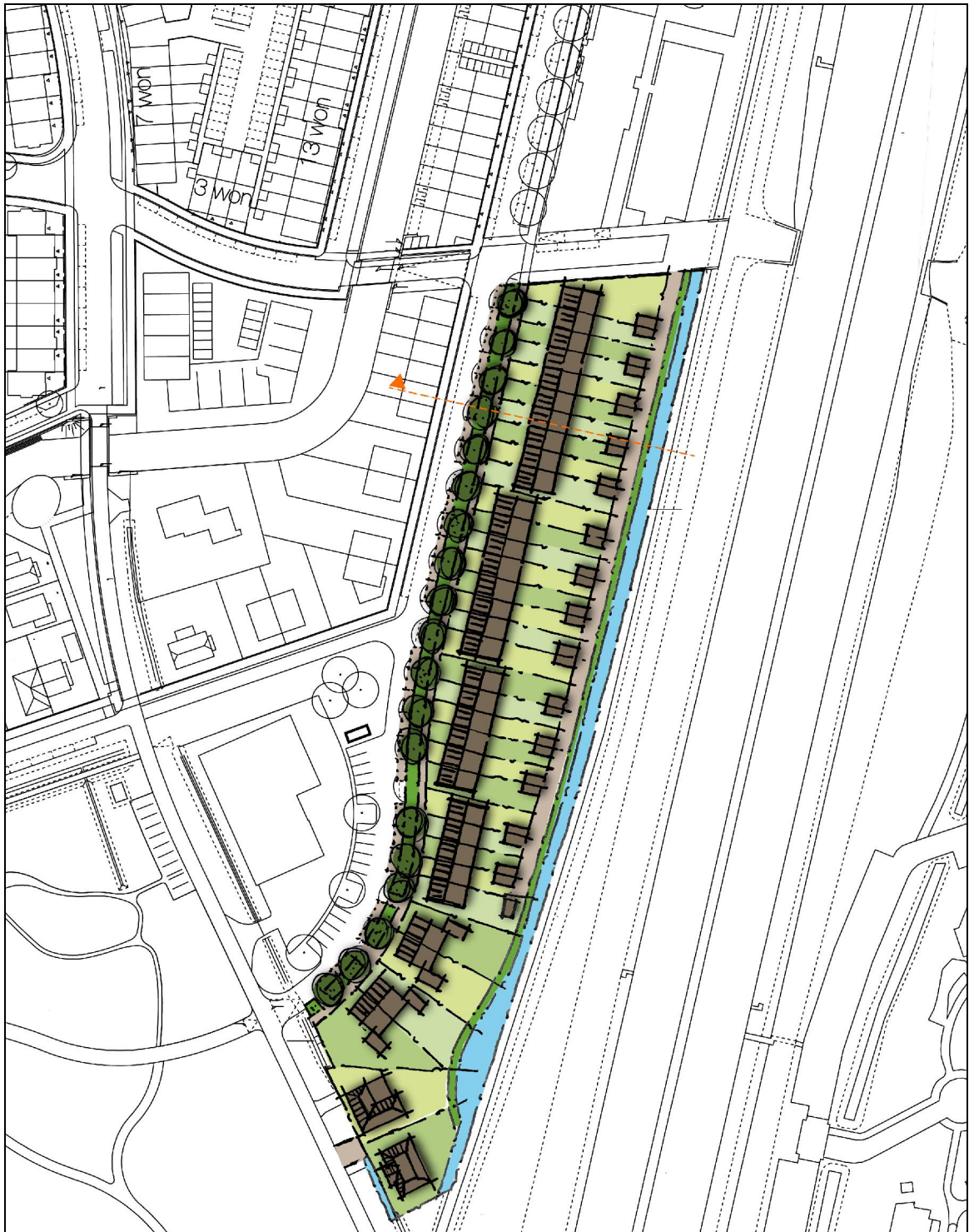
Figuur 3. Impressie van de plannen van de woningbouw Oegstgeest aan de Rijn.