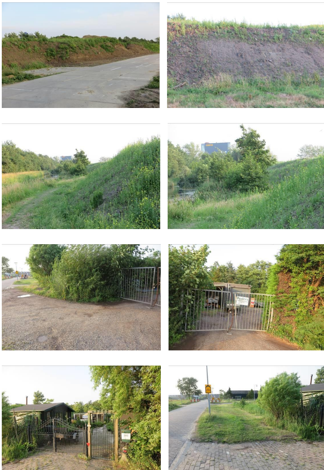
Figuur 2. Foto-impressie van het plangebied Woningbouw Oegstgeest aan de Rijn.