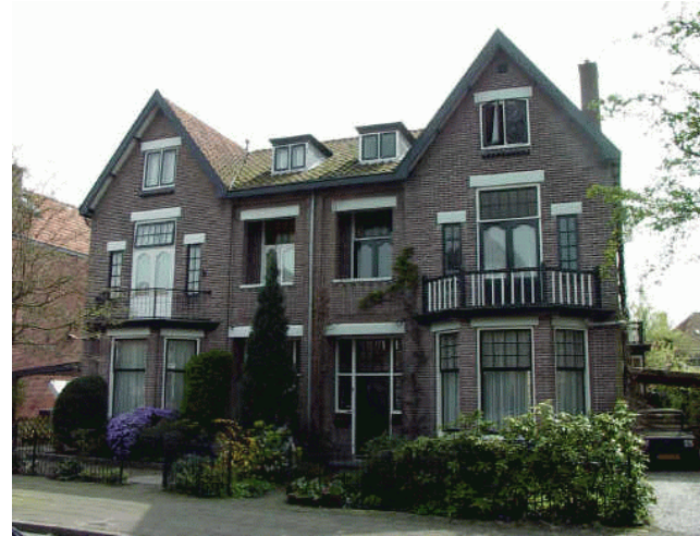
Julianalaan 8; 10

De derde en laatste fase loopt van stapel in 1928, wanneer de Koninginnelaan verder wordt doortrokken, en via een bocht langs het bos van Wijckerslooth (van Griet-huysenplein en Louise de Colignylaan) wordt aangesloten op de Hofdijck en de Terweeweg. Tevens wordt een tweede entree gerealiseerd aan de Rhijngheesterstraatweg: het Oranjepark (de latere Oranjelaan).