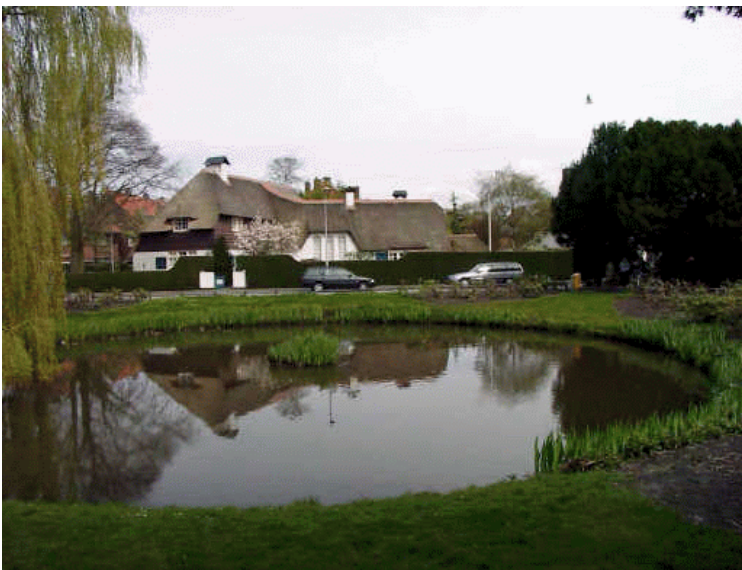
villa, Koninginnelaan 15

Hier is het karakter mede bepaald door de nabijheid van het aan de noordzijde aanpalende Bos van Wijckerslooth. Dit park met landschappelijke aanleg wordt toegeschreven aan de bekende tuin- en landschapsarchitect J.D. Zocher. Het park dateert uit omstreeks 1835 en behoorde bij een in 1915 gesloopt landhuis. Bij de ontwikkeling van de Oranjewijk is dit parkachtige karakter van grote invloed geweest op de stedenbouwkundige opzet, wat te herkennen is in het gebogen stratenpatroon en de ruime opzet van plantsoenen en tuinaanleg. Ook in latere fasen van de stedenbouwkundige ontwikkeling met uitbreiding van woningbouw in oostelijke richting is gestreefd naar voortzetting van de parkachtige opzet.