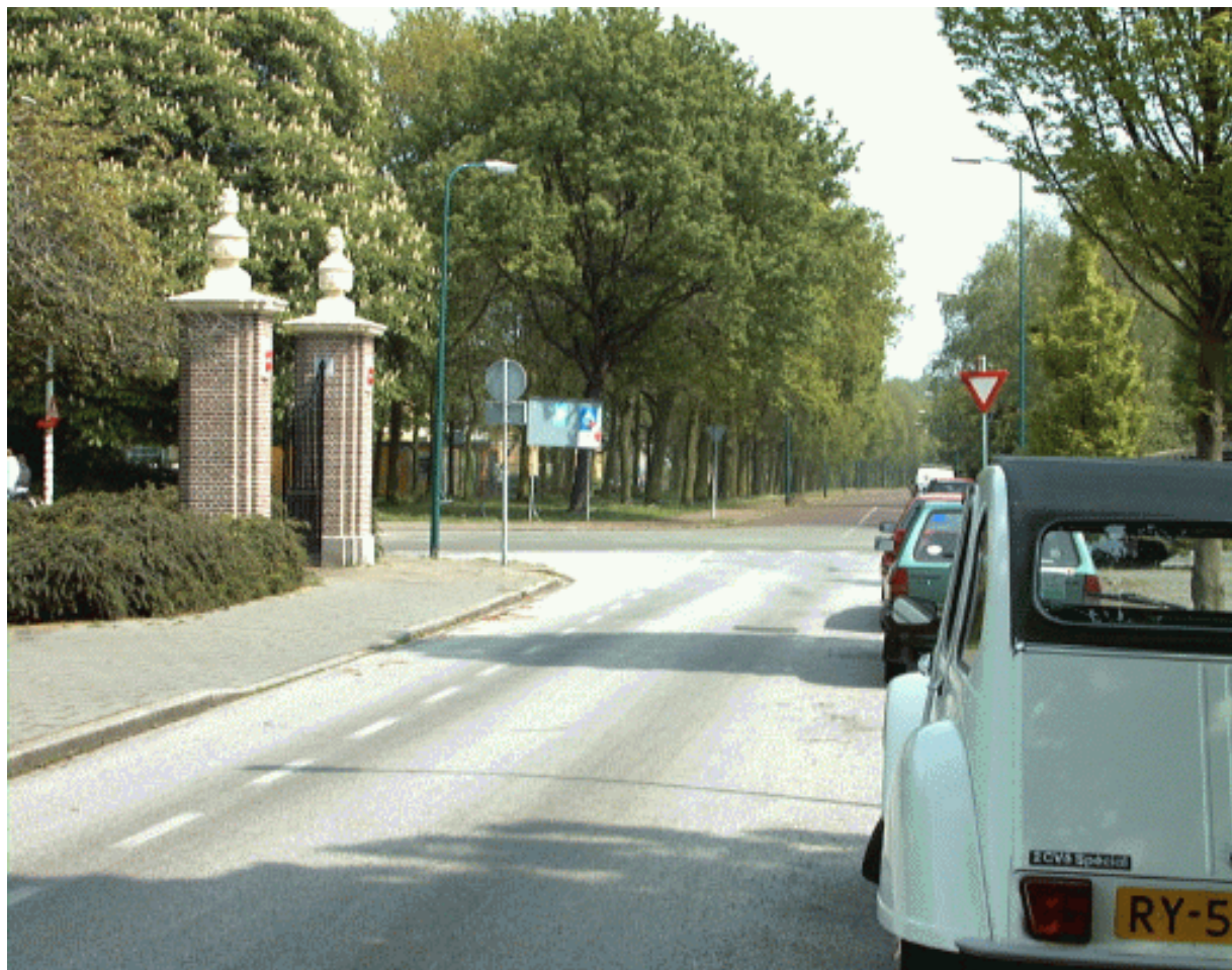
Louise de Coligny laan met zicht op Hofdijk