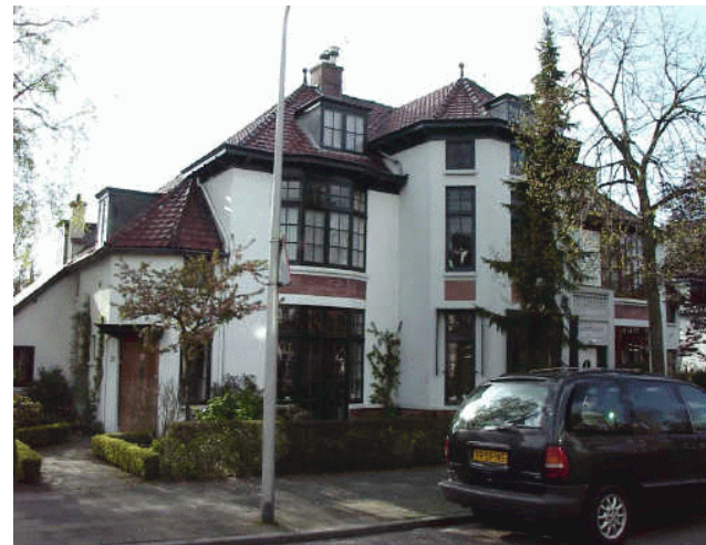
woonhuizen, Terweeweg 29;31;33