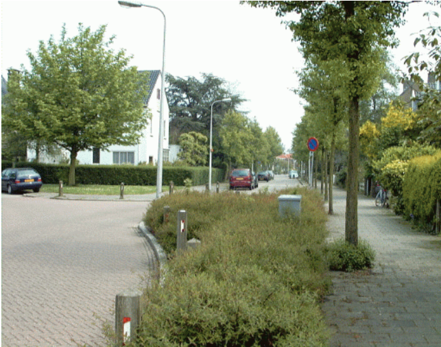
Waldeck Pyrmontlaan, gezien vanaf het Burg. Van Griethuysenplein