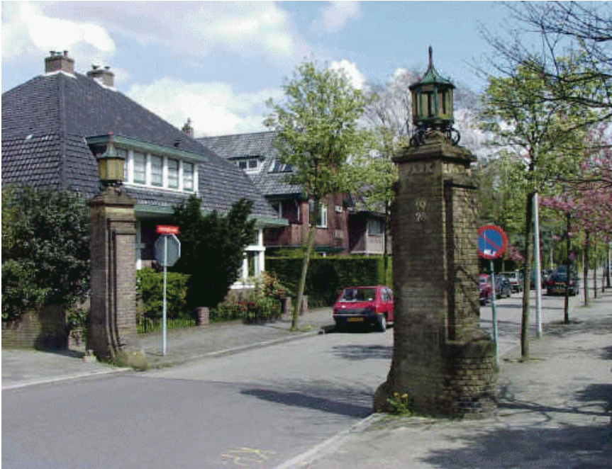
Entree villawijk "Oranjepark"