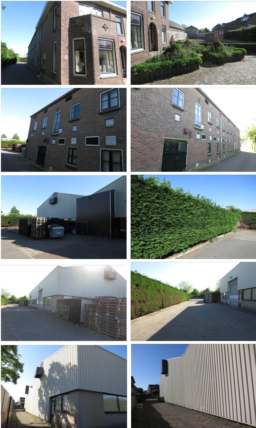
Figuur 2. Foto-impresie van het plangebied Kerkstraat 7 te Noordwijkerhout.