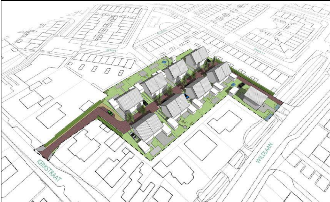
Vervolg figuur 3. Concept plansituatie Kerkstraat 7 te Noordwijkerhout.