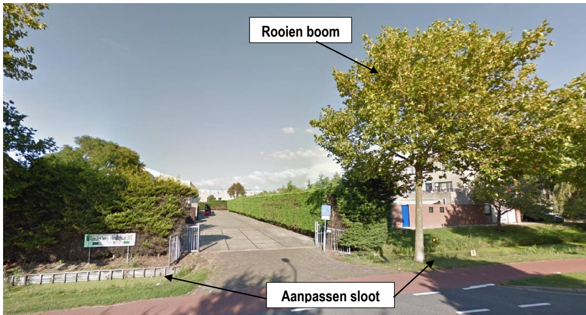
Vervolg figuur 2. Foto-impressie van het plangebied Kerkstraat 7 te Noordwijkerhout.