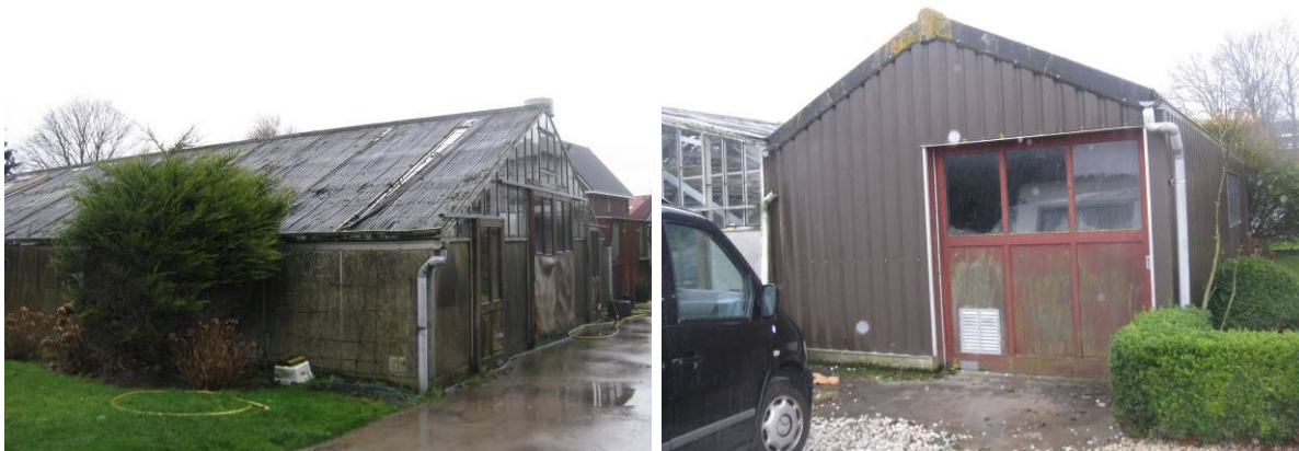
Foto 1 & 2. De gebouwen binnen het plangebied met links de verouderde kas en rechts de schuur.

In het plangebied is een schuur en een verouderde kas aanwezig. Tevens is naast de verouderde kas een klein gebouwtje aanwezig (foto's 1&2). De schuur heeft een dakbedekking met platen en de kas heeft een (niet geheel dekkende) dakbedekking van kleine latten.