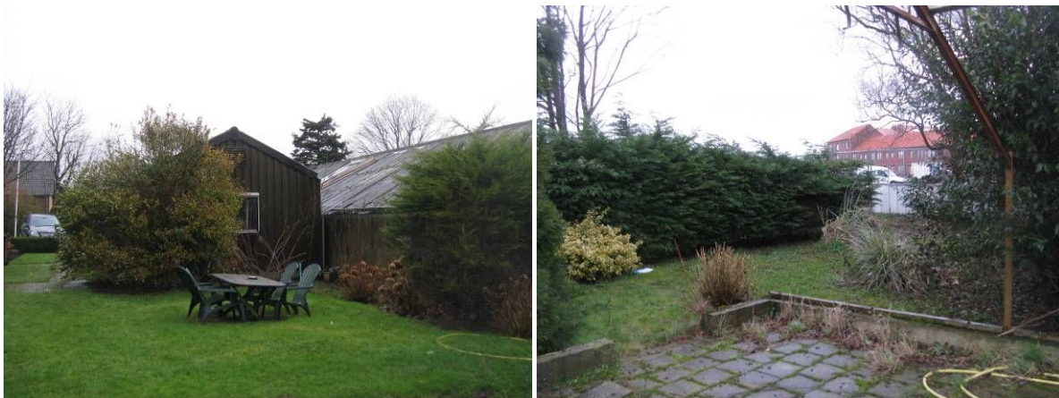
Foto's 5 & 6. Aanwezig tuingroen binnen het plangebied.

Het tuingroen vormt een geschikt leefgebied voor algemeen voorkomende zoogdieren zoals de bosmuis, rosse woelmuis, (gewone) bosspitsmuis en huisspitsmuis (o.a. www.zoogdieratlas.nl ). Daarnaast kan de egel incidenteel in dit biotoop aanwezig zijn. Strikt beschermde zoogdieren, anders dan vleermuizen, zijn niet bekend uit de omgeving van het plangebied.