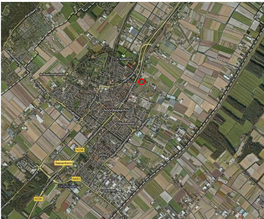
Figuur 1.1. Ligging van het plangebied ten opzichte van Noordwijkerhout.

Ten behoeve van de realisatie van het voornemen zal het bestemmingsplan geactualiseerd worden voor het plangebied. In het kader van het te actualiseren bestemmingsplan zijn enkele gebiedsonderzoeken noodzakelijk, waaronder een natuurtoets. De voorliggende toets geeft inzicht in de voorkomende en de te verwachten beschermde natuurwaarden in het plangebied. De ligging van het plangebied is weergegeven in figuur 1.1.