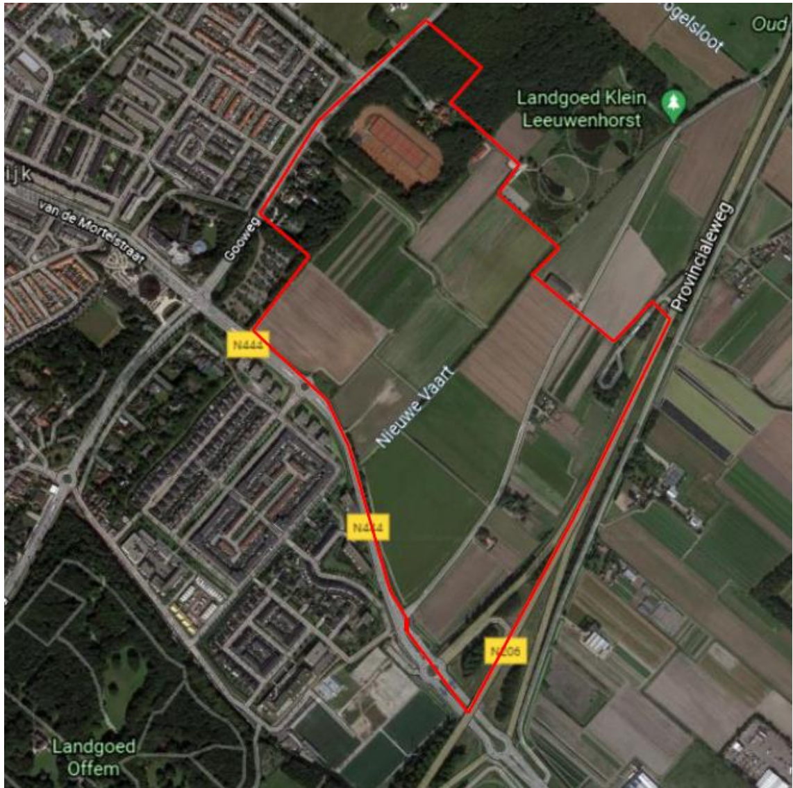
Figuur 1 Plangebied bestemmingsplan "Bronsgaest 2021" rood omkaderd.

Het plangebied en de omgeving daarvan zijn op 6 september 2021 vanaf de openbare weg bekeken. De deskundige van SAOZ heeft niet met derden over het project gesproken.