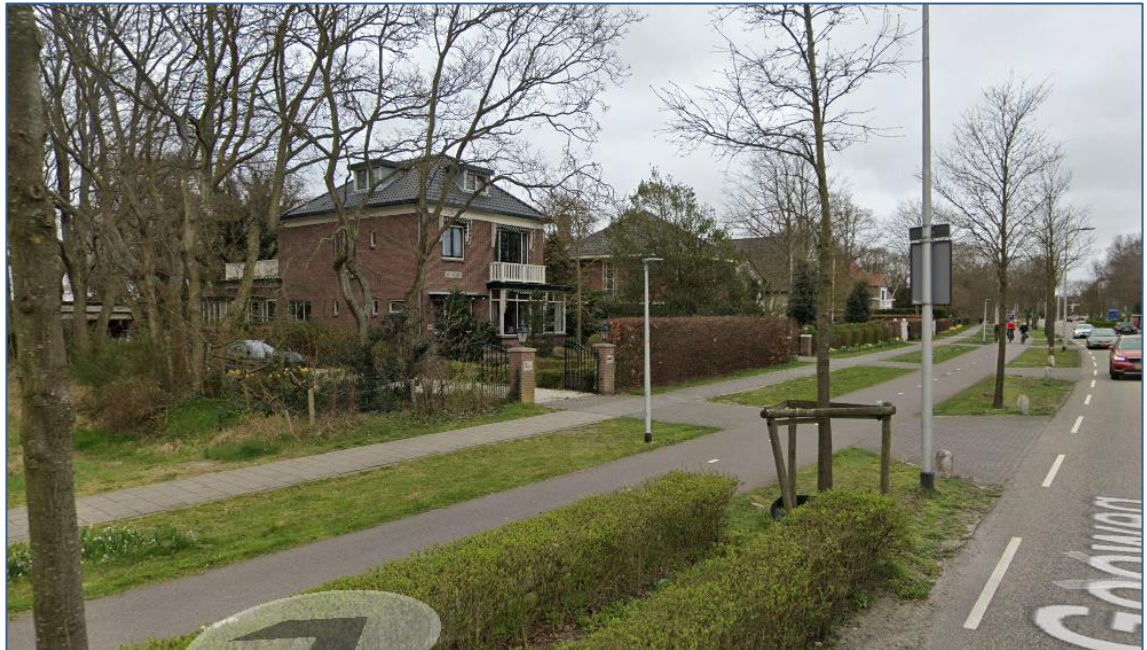
Figuur 7 Impressie objecten.

Deze vrijstaande villa's liggen ten noordwesten van het plangebied en zijn met de achtergevels daarop gericht. Voor een aantal percelen ligt de ontwikkeling ook zijdelings van die percelen. De objecten grenzen direct aan het plangebied.