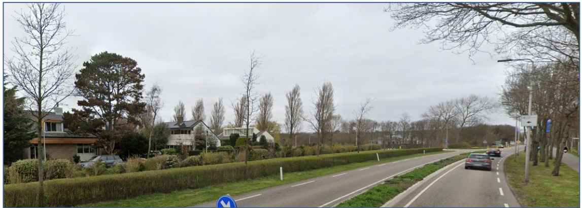
Figuur 6 Impressie straatbeeld (Google Streetview).

Deze woningen liggen langs de noordwestzijde van de Gooweg.