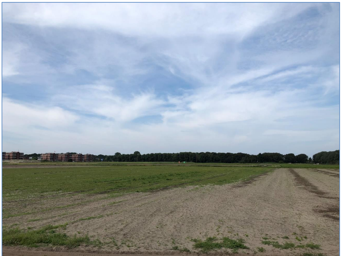
Figuur 2 Het plangebied ten tijde van de opname.

Op het moment van de opname was het te beoordelen deel van het plangebied (de beoogde woningbouwlocatie) niet bebouwd en in gebruik als agrarisch gebied (bollenteelt).