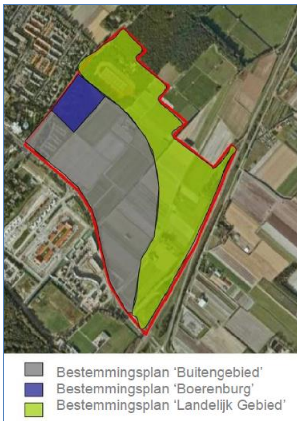
Figuur 3 Overzicht geldende bestemmingsplannen.

Voorts geldt voor het gebied het paraplubestemmingsplan “Parkeren” maar dat is voor dit advies, gelet op de huidige bestemmingen van het gebied, niet relevant.