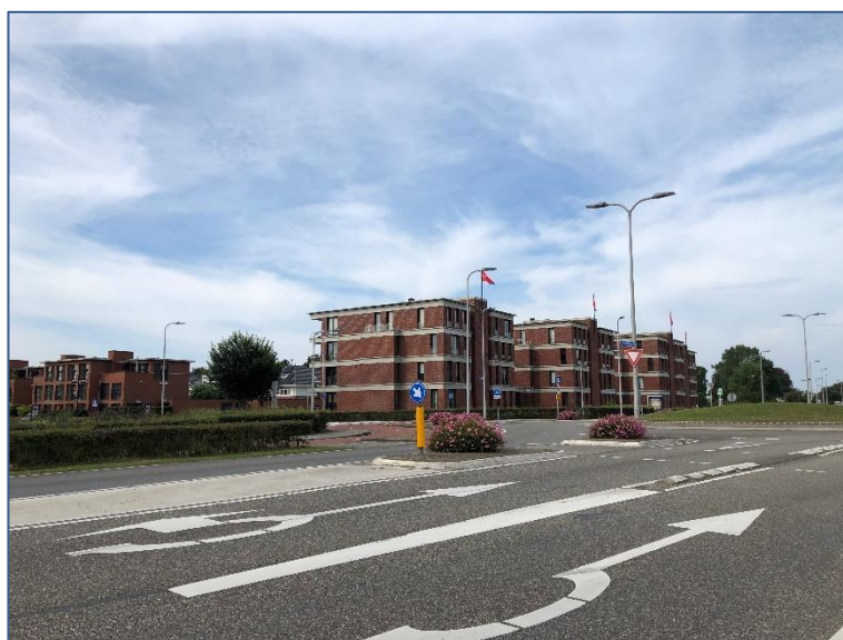
Figuur 8 Straatbeeld.

Deze appartementen liggen ten zuidwesten van het plangebied en zijn met verblijfsruimten daarop gericht. De objecten worden van het plangebied gescheiden door de intensief gebruikte Van Berckelweg. De afstand tot de voorgenomen woningbouw zal zo'n 50 tot 60 meter bedragen.