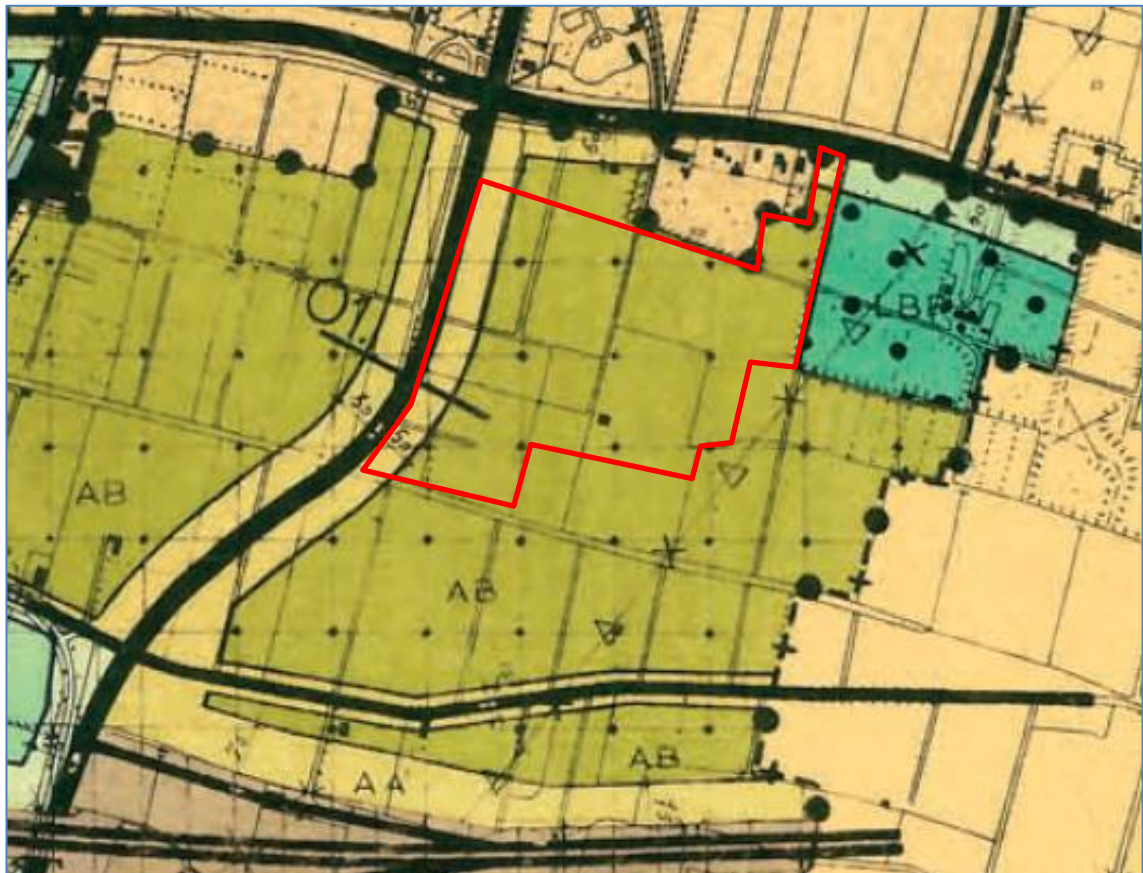
Figuur 4 Fragment plankaart. Te beoordelen deel plangebied globaal rood omkaderd.

Het plangebied heeft de volgende bestemming: