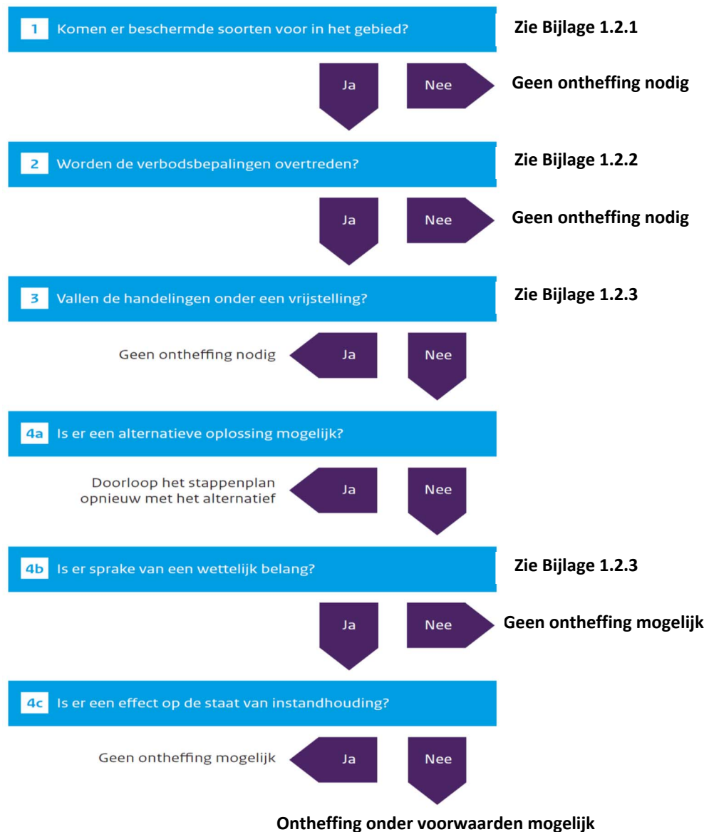
Figuur 2. Stappenplan procedure ecologisch onderzoek en ontheffing