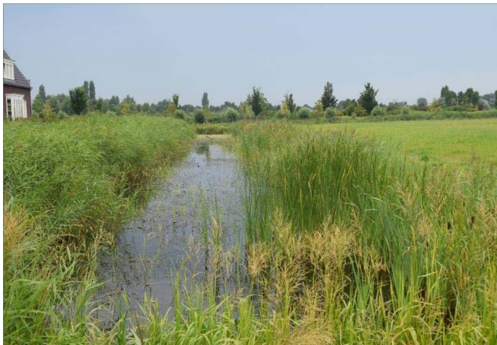
Sloot met goed ontwikkelde submerse vegetatie en dicht begroeide oevers in het plangebied.

Omdat geen smalle geïsoleerde venige sloten met waterplanten en drijfbladplanten aanwezig zijn, wordt het voorkomen van de Platte schijfhoren uitgesloten.