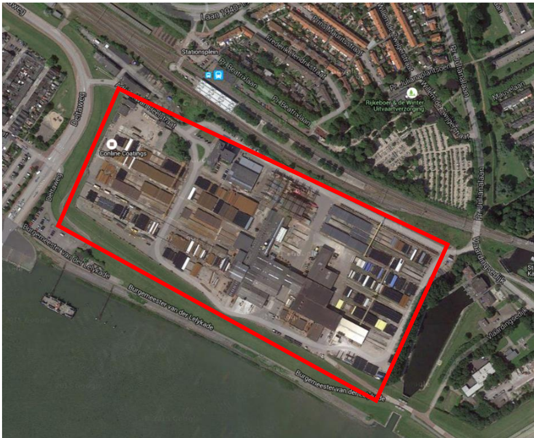
Figuur 2.1: Plangebied (rood)