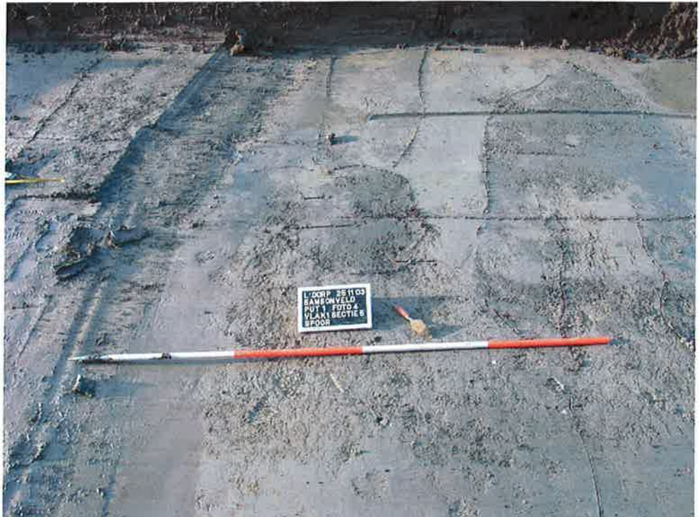
Figuur 7. Amorfe sporen/verkleuringen, put 1, vlak 1 (ArcheoMedia 2003).