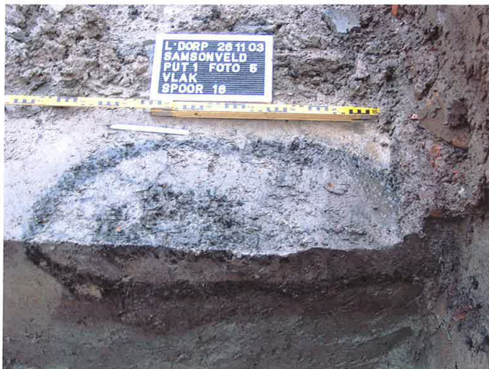
Figuur 1. Coupe spoor 18 (ArcheoMedia 2003).

Dhr. R. Proos liet ter ondersteuning van zijn constatering inzake de vermeende nederzetting één van de ArcheoMedia foto's zien waarop een spoor (spoor 18) zichtbaar is (Zie figuur 1). Het lijkt er echter op dat spoor 18 uit de bouwvoor komt en een directe relatie heeft met een met modern puin gevulde kuil. Wat verder opvalt is dat alleen op de plek waar een dergelijke recente verstoring is aangetroffen ook het vermeende spoor ligt. De aangrenzende lagen zijn, sedimentair gezien, gewoon keurig gelamineerd. Uit de documentatie (zie ook figuur 3) blijkt dat het spoor geïsoleerd is aangetroffen en dat er geen ruimtelijke relatie is met andere sporen. In figuur 3 lijkt het erop dat het spoor onderdeel is van een greppelvormige structuur waarin recent bouwmetaal aanwezig lijkt te zijn.