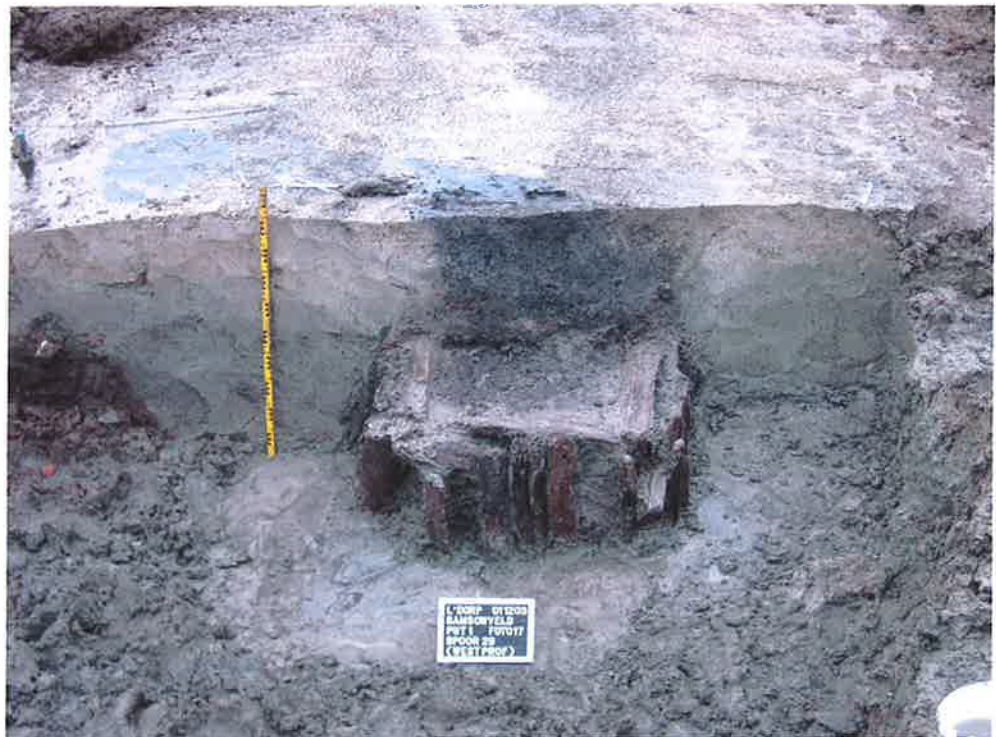
Figuur 8: Waterput Samsonveld

Bovendien doorsnijdt de waterput sedimenten die afgezet zijn op de 9e eeuwse beschoeiingen. De dikte van dit pakket is zodanig dat het onwaarschijnlijk is dat de waterput ook uit de vroege middeleeuwen stamt. Niet alleen is de put aangelegd nadat de lagen zijn afgezet, ook zal de put pas zijn aangelegd nadat de voormalige bedding met stromend water volledig verland was geraakt. Met een nog actieve geul in de 9e eeuw, zelfs zo actief dat beschoeiing en aamplemping met bouw materiaal nodig is, is het niet aannemelijk dat in de 9e tot 10e eeuw dezelfde geul al zover verland is dat een waterput moet worden geslagen.