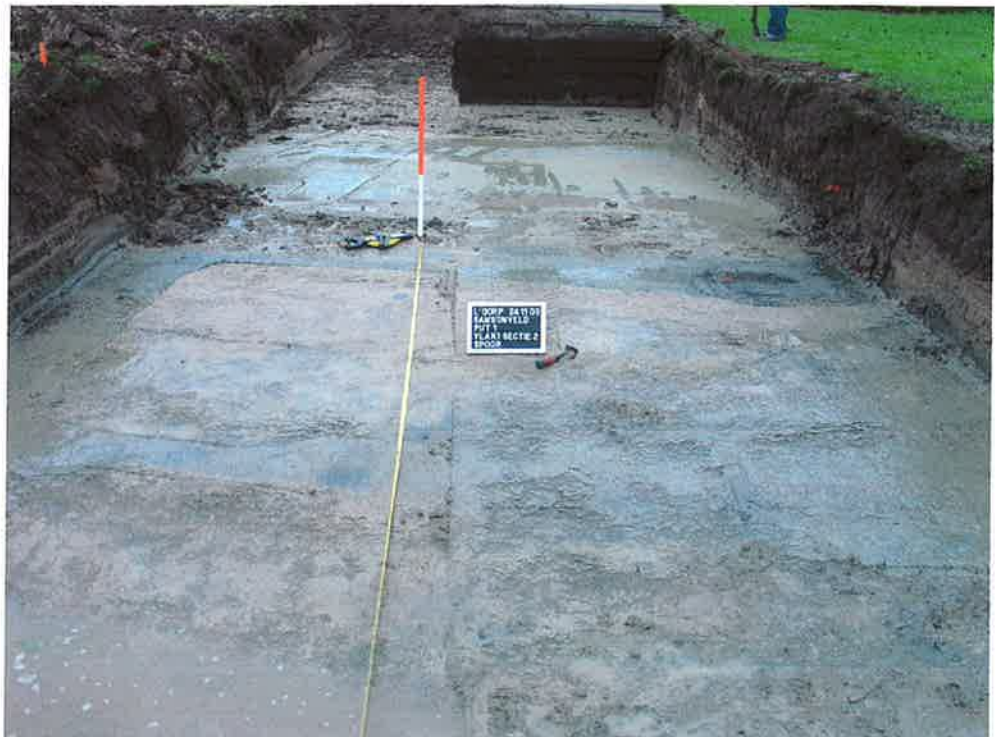
Figuur 4. Horizontale context spoor 18, rechtsboven. De greppelvormige, rechthoekige structuur is met name op de linker helft van de foto zichtbaar (ArcheoMedia 2003).

Kijkend naar veldtekeningen en de foto's dan blijkt zonder meer dat de overige sporen (of fenomenen) zeer amorf zijn. De karakteristieken wijzen in eerste aanblik op natuurlijke verkleuringen. Ook een blik op de vlaktekeningen laat grote amorphe verkleuringen zien. Er is geen eenduidige clustering van fenomenen behalve de 4 kleine ronde mogelijke sporen in werkput 2, vlak 2 (figuur 5) en drie in werkput 1, vlak 1 (figuur 7). Deze sporen hebben mogelijk hun origine in een nederzetting, bijvoorbeeld als paalspoor. Echter, de betreffende fenomenen uit put 2 hebben in het ArcheoMedia onderzoek geen spoornummer gekregen en zijn om vooralsnog onduidelijke redenen niet als spoor aangemerkt. Het is op basis van het documentatiemateriaal onmogelijk te zeggen wat de hiervan ouderdom is. De geclusterde ronde fenomenen in put 1 zijn op ca. 40 meter van het hoofdmeetpunt aangetroffen, op enkele meters van de waterput (spoor 29). Ook deze fenomenen zijn door de uitvoerders niet als spoor aangemerkt. De kleur van de vulling wijkt zo zeer af van de omliggende middeleeuwse geulvulling, dat het zeer goed mogelijk is dat deze sporen uit de Nieuwe Tijd dateren. Deze sporen zijn gedocumenteerd in het 2e vlak. Helaas ontbrak in de documentatie een tekening van het eerste vlak van deze opgravingput.