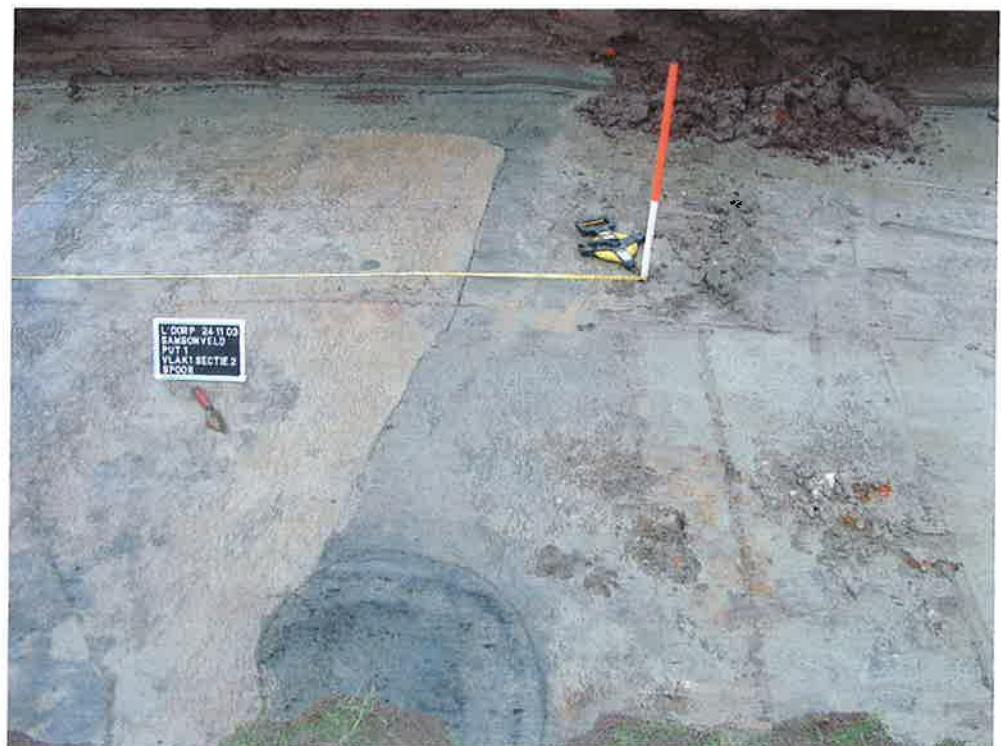
Figuur 3. Horizontale context spoor 18 (ArcheoMedia 2003).