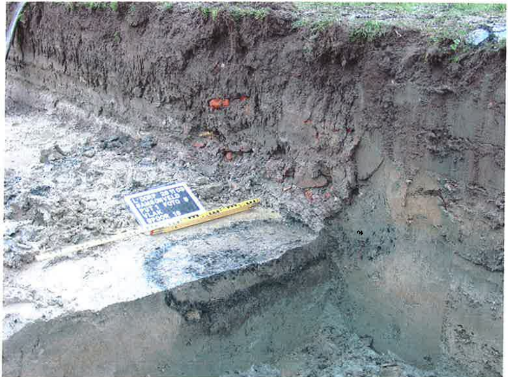
Figuur 2. Verticale context spoor 18 (ArcheoMedia 2003).