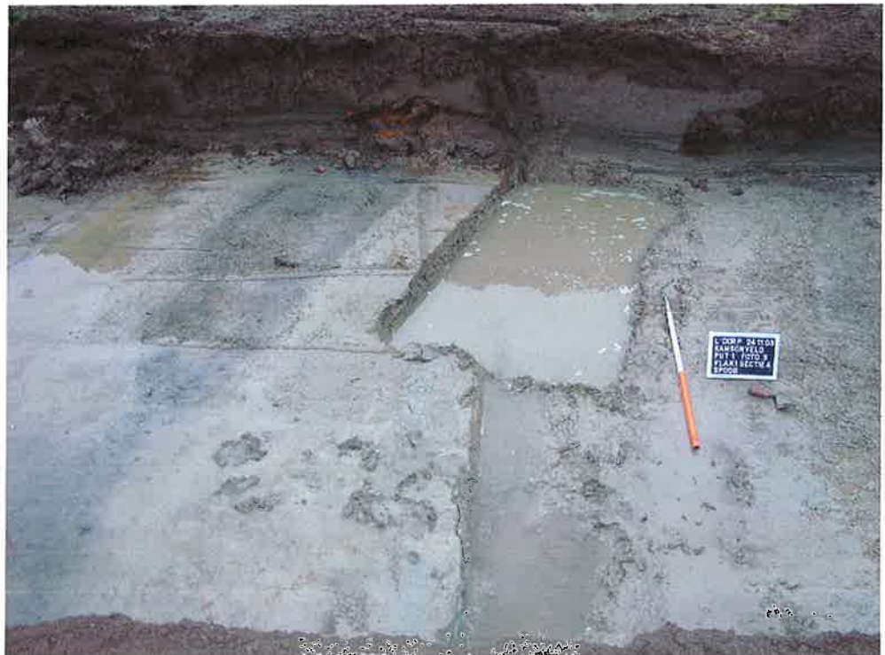
Figuur 6. Rechthoekig spoor, put 1, vlak 1 (ArcheoMedia 2003). Let op de recente versterking in de profielwand ter hoogte van het spoor