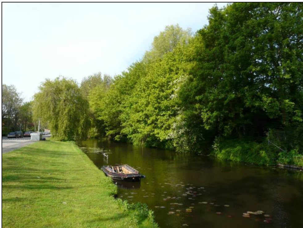
Figuur 3. De bomen aan de zuidrand van het plangebied ontnemen zicht en licht op het Agnesgebouw.