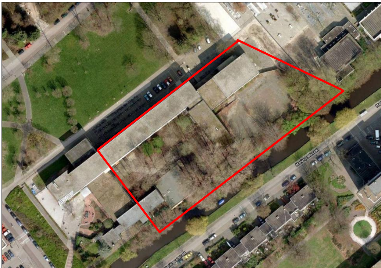
Figuur 2. Het Agnesgebouw. De rode lijnen duiden de beschermde situatie.