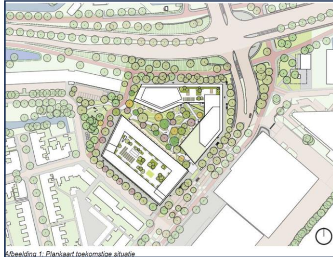
Afbeelding 1. Plankaart toekomstige situatie

Het plan bestaat uit het realiseren van 576 nieuwe woningen en 2500 m 2 commerciële ruimten in de plint aan de zijde van de Vondellaan en de Plesmanlaan en gesitueerd rondom het pocketpark. De verdiepingen erboven zijn voornamelijk bestemd voor wonen. Het totale plan zal bestaan uit een tweetal bouwblokken. Op het zuidelijke blok, boven de parkeergarage, ligt een grote daktuin voor de bewoners. Deze daktuin is niet alleen een aantrekkelijke plek, maar zorgt ook voor verkoeling door de toepassing van beplanting en wateropvang. Daarnaast kan er ook door bewoners op worden getuinierd. Het noordelijk blok is een hoog stedelijk blok waarbij de architectuur van de afgeschuinde en getrapte massa zorgt voor de karakteristiek. Zie afbeelding 1.