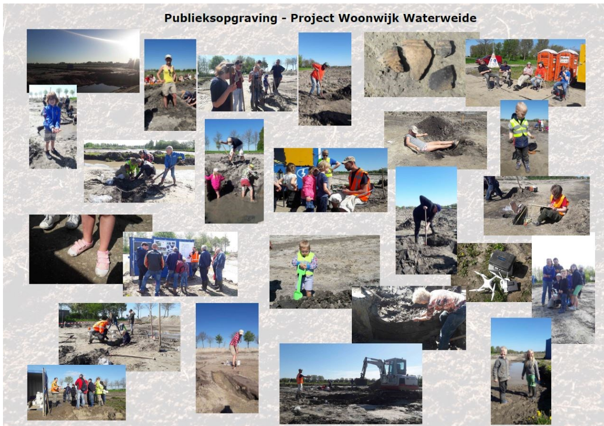
Afbeelding 2. Impressie van de publieksopgraving in de periode 2 tot en met 9 mei 2018.