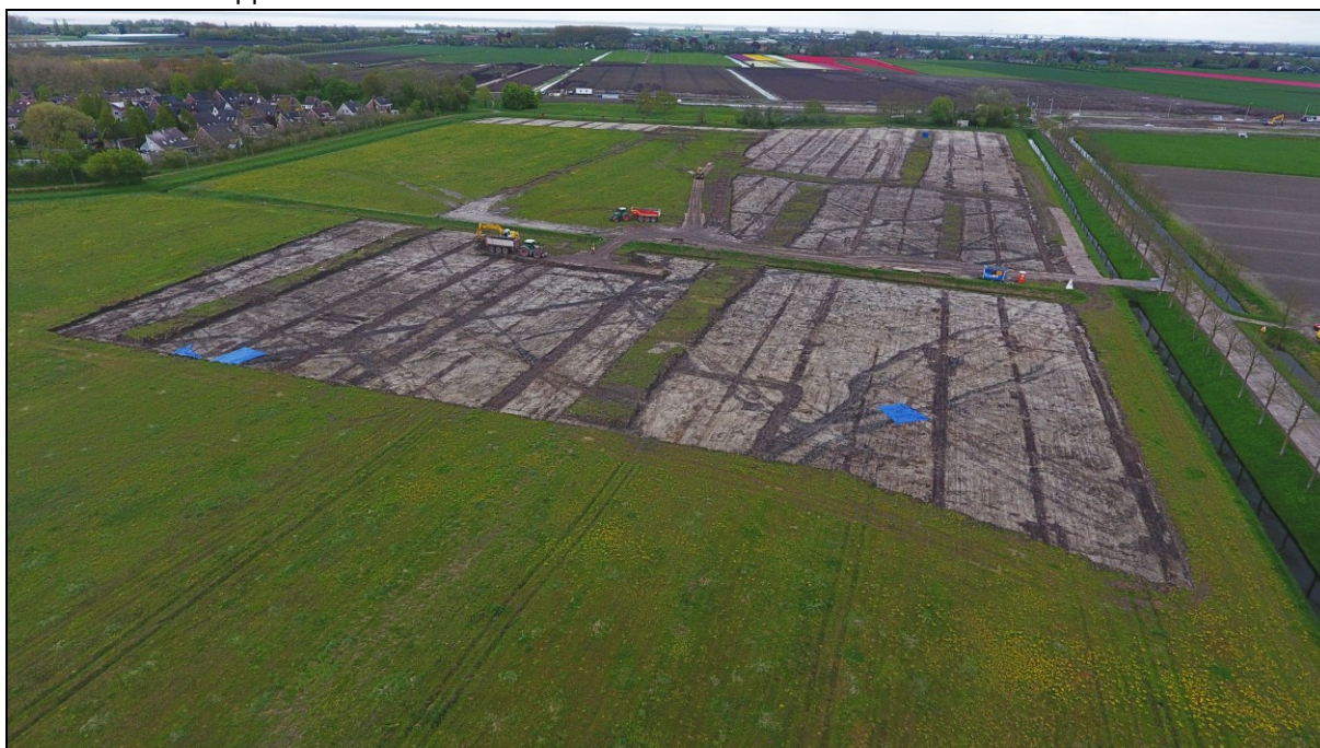
Afbeelding 1. Overzicht van de opgraving voor de start van de publieksofgraving.

De zes graafdagen waren een groot succes. Vrijwel alle inschrijvingen voor het ochtend- en middagprogramma zaten vol (20-30 man per dagdeel). In totaal hebben naar schatting 250 mensen meegegraven, waaronder 100 kinderen. Op zaterdag 12 mei hebben we een open dag georganiseerd, in samenwerking met vrijwilligers van Vereniging Oud Stede Broec en het Zuiderzeemuseum in Enkhuizen. De open dag is door naar schatting 75 mensen bezocht. Tevens is een enquête vervaardigd voor de meegravers. De resultaten daarvan zullen worden opgenomen in het onderzoeksrapport.