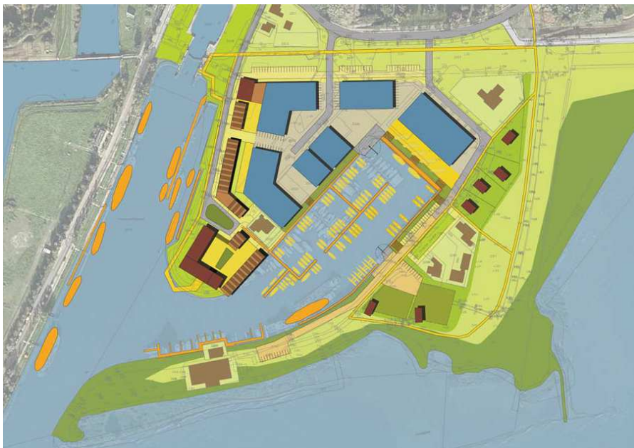
Figuur 2: Voorgenomen ontwikkeling Veerhaven. De rode lijn geeft het plangebied weer. De blauwe gebouwen vormen de nieuwe bedrijven. De rode gebouwen geven woningen weer.

In het plangebied worden een aantal bedrijven verplaatst en er komen enkele bedrijven bij (aangegeven met blauw in figuur 2). Daarnaast worden in het plangebied 90 – 100 woningen gebouwd (aangegeven met rood in figuur 2), de kade verbeterd, nieuwe steigers en een wandelpad aangelegd.