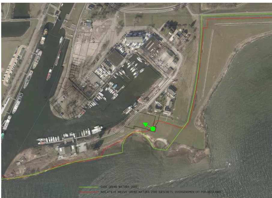
Figuur 3: Herbegrenzing van het Natura 2000-gebied Haringvliet ter hoogte van de Veerhaven. Met de groene pijl is de locatie aangegeven van het bedrijf dat wordt verplaatst buiten de grenzen van het Natura 2000-gebied.

Het voornemen zoals weergegeven in figuur 2 is reeds getoetst in de Natuur- en habitattoets. In figuur 3 is de herbegrenzing van het Natura 2000-gebied Haringvliet weergegeven. Met de groene cirkel is het bedrijfsgebouw weergegeven die volgens de nieuwe begrenzing nu in het Natura 2000-gebied Haringvliet komt te liggen. Om negatieve effecten op de natuur zo veel mogelijk te beperken heeft de gemeente Hellevoetsluis aangegeven dit bedrijf te verplaatsen buiten de nieuwe grenzen van het Natura 2000-gebied.