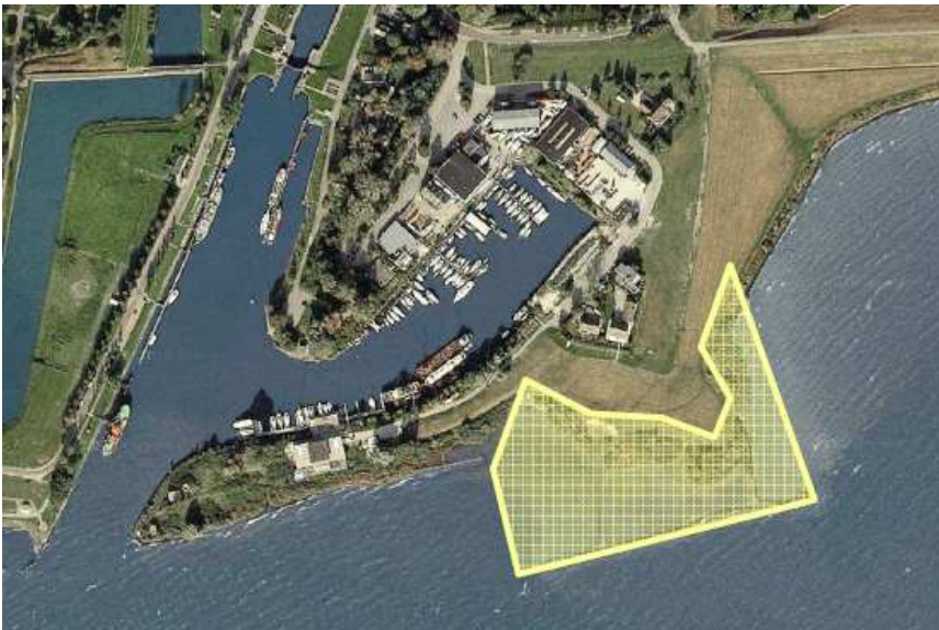
Figuur 5: Globale ligging van het habitatype slikkige rivieroever (H3270) nabij het plangebied.