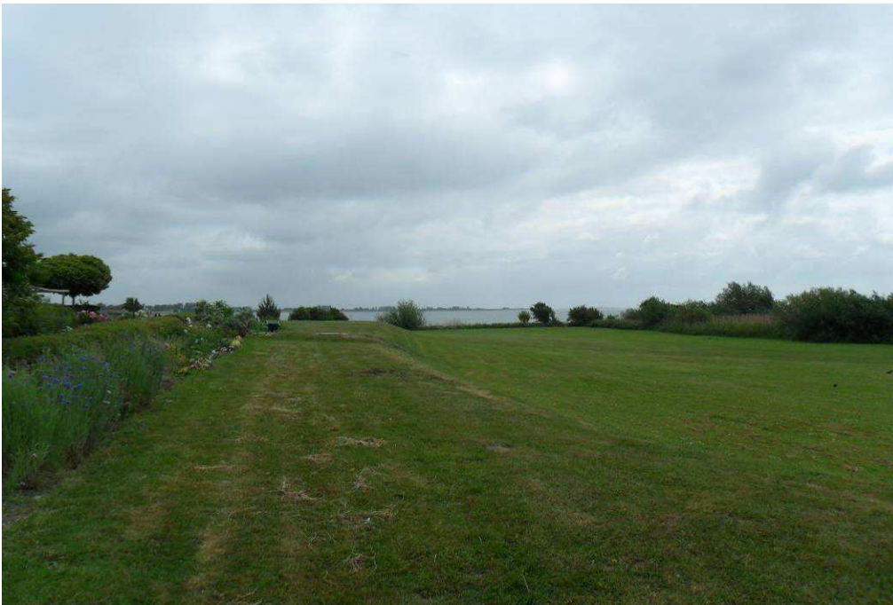
Figuur 4: Dit gebied maakt, na de herbegrenzing, onderdeel uit van het Natura 2000-gebied Haringvliet. het toe te voegen gebied bestaat uit intensief beheer grasland.

De nieuwe grens van het Natura 2000-gebied Haringvliet (rode lijn in figuur 3) valt een klein gedeelte van het plangebied Veerhaven binnen dit beschermd gebied. Dit gebied bestaat in de huidige situatie in zijn geheel uit gazon. Door het beheer van het grasland is het floristisch gezien matig interessant. Er komen geen beschermde plantensoorten voor. Wel zijn sporen van konijnen aanwezig.