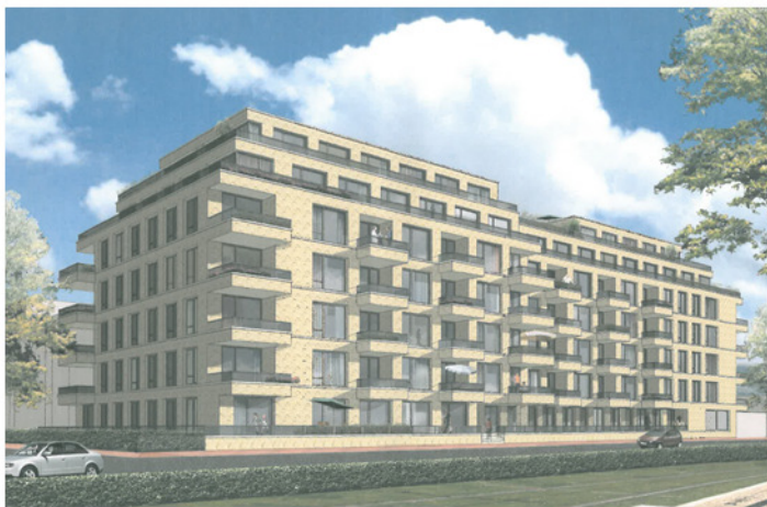
Verbeelding van de wenselijke nieuwbouw.