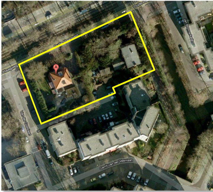
Detailopname van het plangebied. Het plangebied wordt met de gele lijn aangeduid.