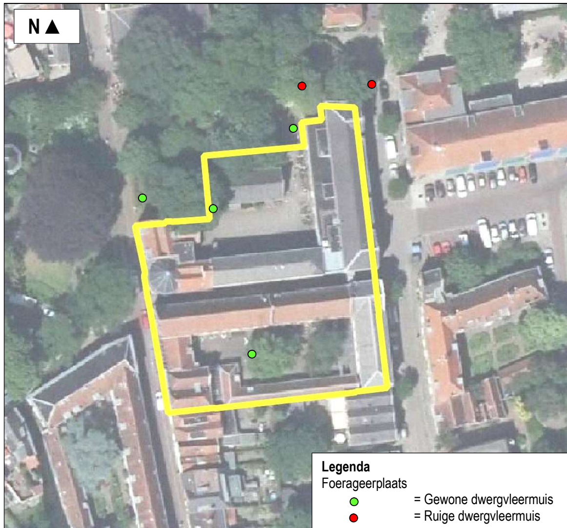
Figuur 3. Waarnemingen van vleermuizen in de voorherfst in en direct rond het onderzoeksgebied aan de het Weeshuis-complex te Gouda.

In de voorherfst zijn twee soort vleermuizen waargenomen (gewone en ruige dwergvleermuis). Deze soorten zijn (in lage dichtheid) foeragerend aangetroffen ter plaatse van en rond het Weeshuis-complex te Gouda. Er zijn geen balts- of paarplaatsen vastgesteld. In figuur 3 zijn de waarnemingen weergegeven.