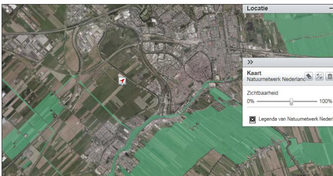
Figuur 4.3: Ligging Natuurnetwerk Nederland (groen gearceerd) ten opzichte van het plangebied (rode pijl).

De provincie Zuid-Holland heeft geen compensatiebeginsel meer voor Rode lijstsoorten. Er is dus – in tegenstelling tot 2008 – geen noodzaak meer voor het compenseren van verlies aan leefgebied van weidevogels van de Rode lijst. Bovendien heeft weidevogelcompensatie voor het gehele plangebied Westergouwe reeds plaatsgevonden. Er zijn vanuit de vigerende provinciale ruimtelijke verordening van Zuid-Holland geen belemmeringen voor het vaststellen van het plan ten aanzien van Rode lijstsoorten.