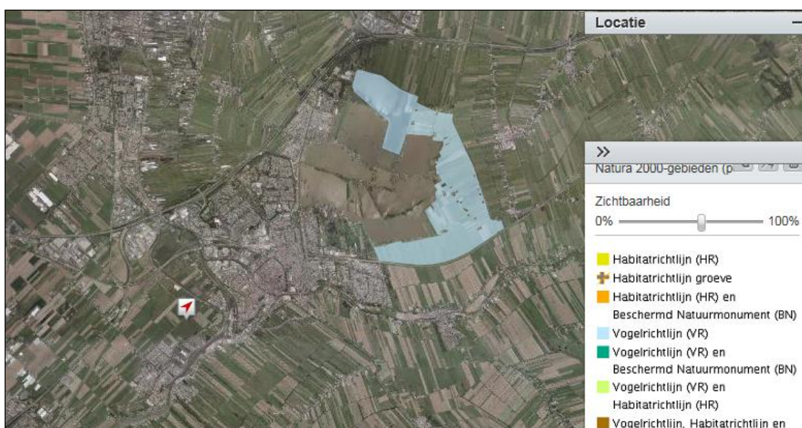
Figuur 4.1: Ligging Natura 2000-gebied Broekvelden, Vettenbroek & Polder Stein (blauw gearceerd) ten opzichte van het plangebied (rode pijl).

Het plangebied maakt geen onderdeel uit van de begrenzing van een Natuurbeschermingswetgebied. Van oppervlakteverlies van kwalificerende habitattypen en/of leefgebieden van kwalificerende soorten is derhalve geen sprake. Het dichtstbijzijnde Natuurbeschermingswetgebied is het Natura 2000-gebied Broekvelden, Vettenbroek & Polder Stein op ca. 5,3 km afstand van het plangebied. Andere Natuurbeschermingswetgebieden liggen op grotere afstand (> 10 km) van het plangebied.