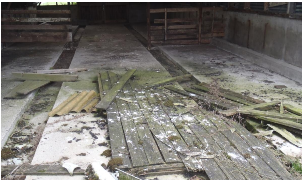
Foto 3.2.2-4: braakballen en uitwerpselen van steenuil in het schuurtje in het plangebied.

Onder de huismussenkasten en boerenzwaluwnesten in het schuurtje zijn uitwerpselen van vogels gevonden. Waarschijnlijk worden deze nestplaatsen door deze soorten gebruikt om te broeden. In het schuurtje zijn geen nesten van andere vogelsoorten met een jaarrond beschermde nestplaats aangetroffen.