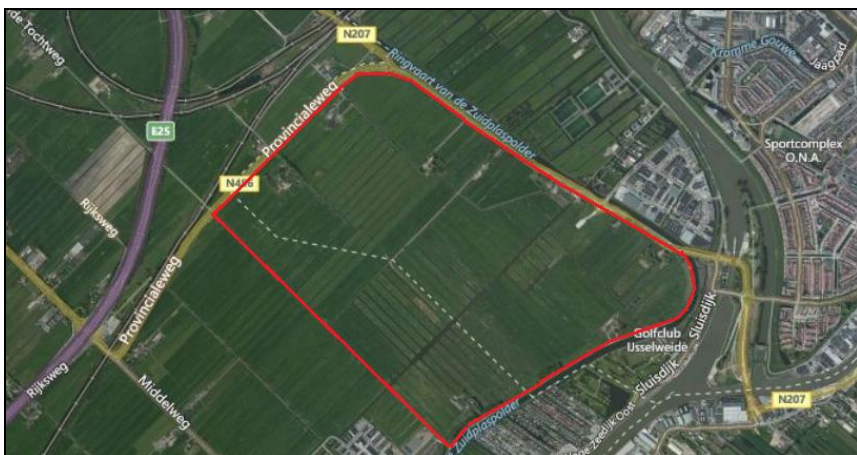
Figuur 2.1: Globale ligging totale bestemmingsplan Westergouwe (rood omlind).

Westergouwe is een nieuwe woonwijk aan de westkant van Gouda van in totaal ca. 4.000 woningen. Op onderstaande figuur is de globale begrenzing van het totale plangebied van Westergouwe weergegeven. In dit gebied heeft in 2014 een actualiserend natuuronderzoek plaatsgevonden.