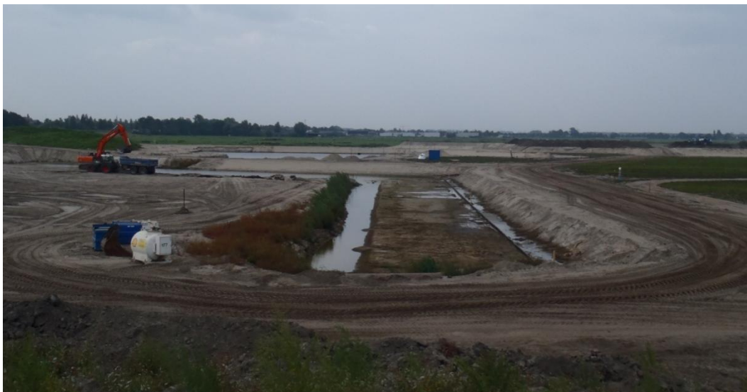
Foto 3.2.2-3: Geschikt leefgebied voor de rugstreepad in het noordoostelijk deel van het plangebied waar momenteel wordt gewerkt (fase 1).