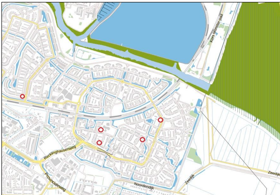
Figuur 2: Ligging deelgebieden (rood omcirkeld) t.o.v. Natura 2000-gebied de Biesbosch (gearceerd) en het NNN (groen en blauw ingekleurd)

Bij een verwachte toename in stikstofdepositie als gevolg van bijvoorbeeld een toename in de verkeersgeneratie, is wel een toetsing in het kader van de Programmatiese Aanpak Stikstof (PAS) nodig. Een dergelijke toetsing is niet opgenomen in deze rapportage.