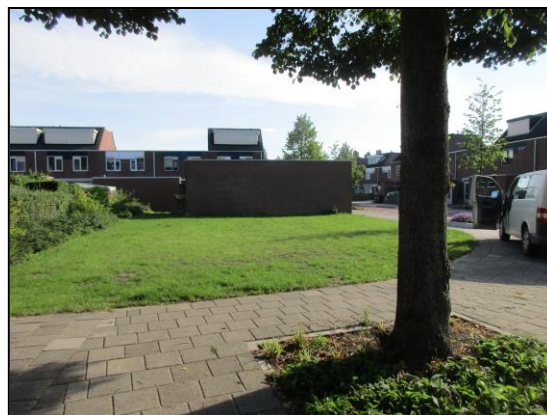
Foto 2: Deelgebied 1