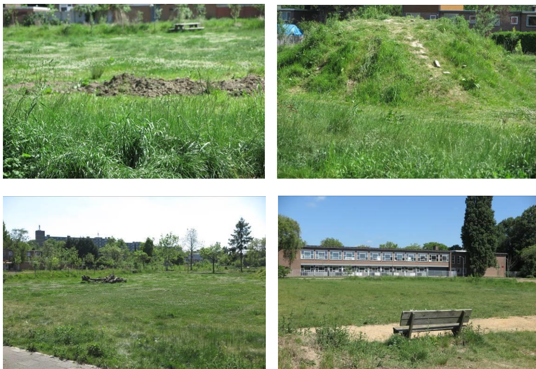
Vervolg figuur 2. Foto-impressie van het plangebied aan de Patersweg te Dordrecht.