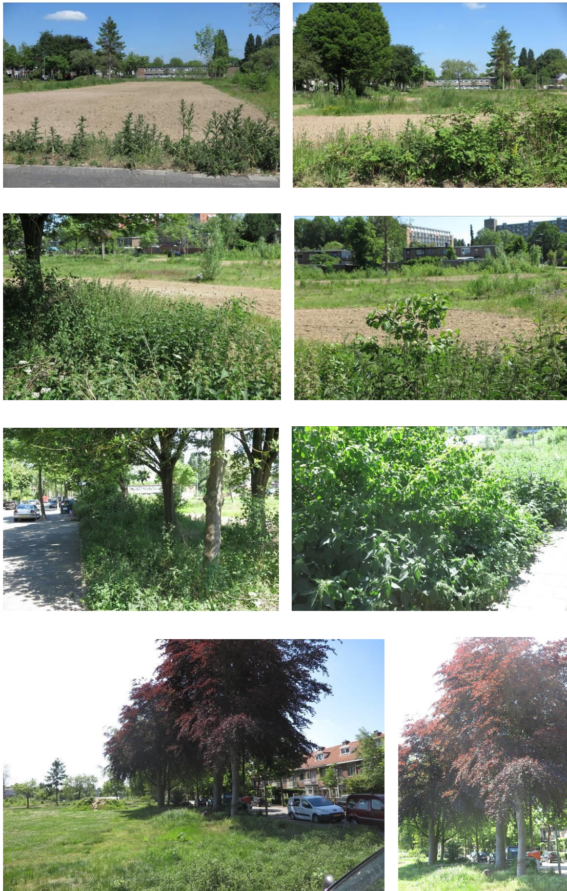
Figuur 2. Foto-impressie van het plangebied aan de Patersweg te Dordrecht.