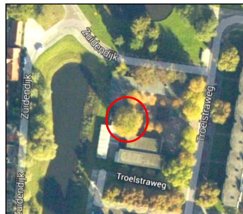
Figuur 3. Te behouden boom.

Met de realisatie van de plannen zal het gebied van vorm veranderen. Mogelijk foerageert er gewone dwergvleermuis en laatvlieger. Het plan is om op het schoolplein de bomen eveneens te rooien. De oude esdoorn op het plein is echter mogelijk van essentieel belang als foerageergebied voor vleermuizen. Het is derhalve van belang dat deze boom bij de sloop blijft behouden. Bij ontwikkeling van de plannen kan dan later worden onderzocht of deze boom moet worden geroid. Bij behoud van deze boom worden effecten op de foerageermogelijkheden van vleermuizen uitgesloten.