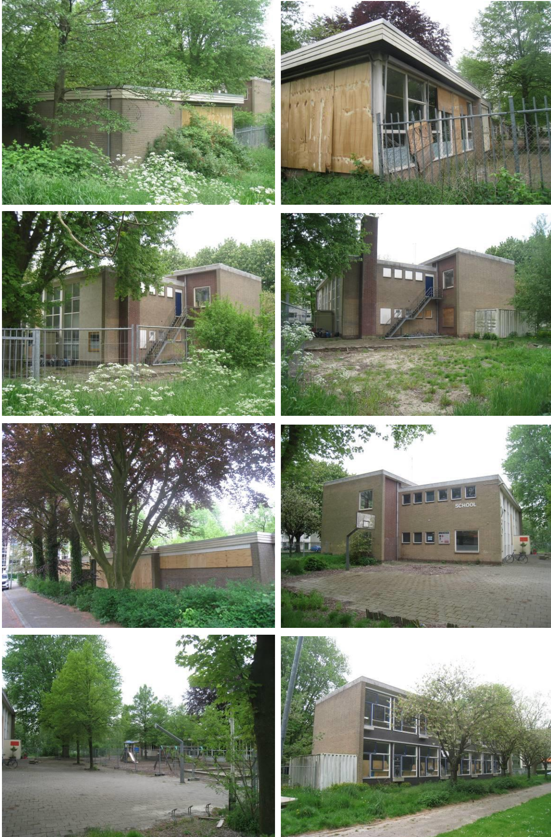
Vervolg figuur 2. Aanzicht van Troelstraweg 125-127 te Dordrecht.