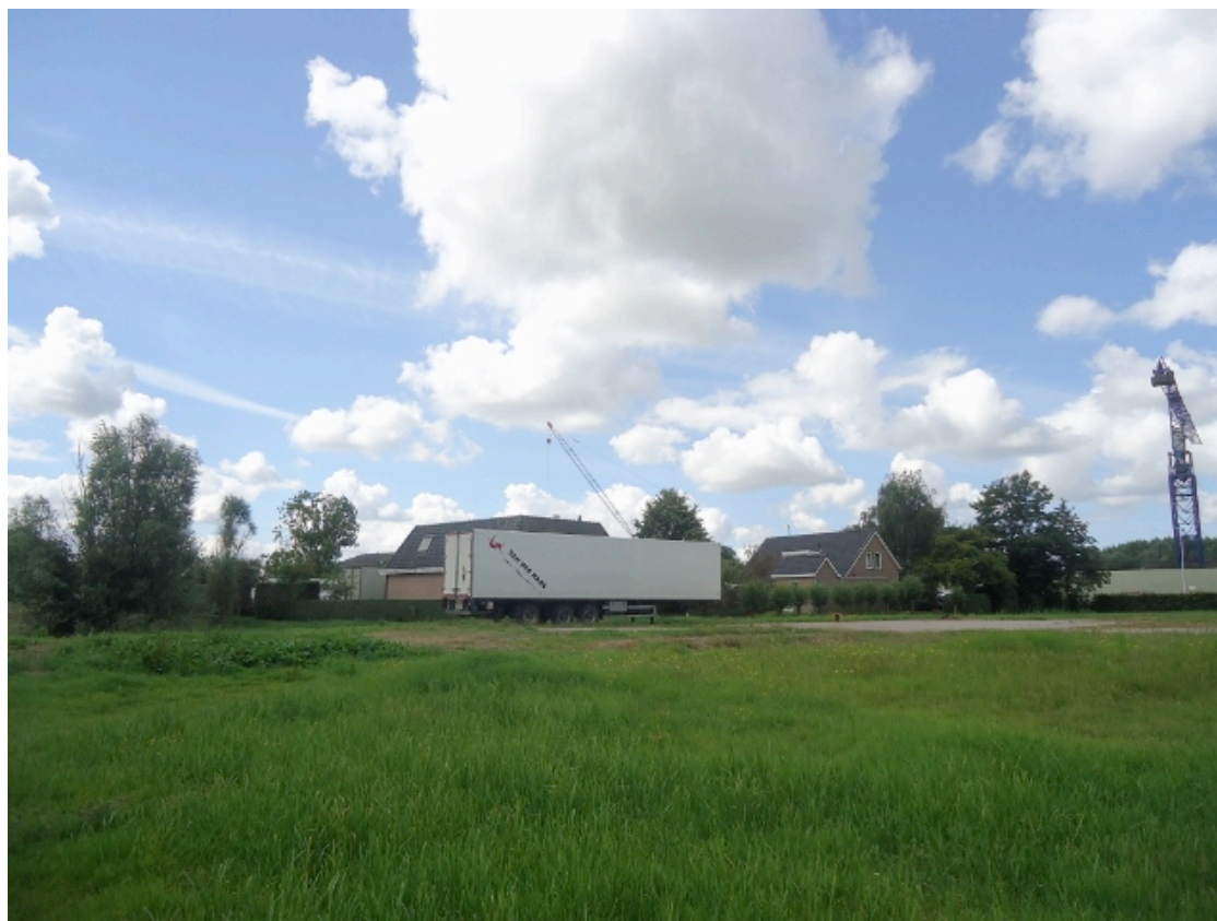
Zicht op de twee panden en braakliggende perceel.

Tijdens de visbemonstering zijn ook de niet beschermde driedoornige stekelbaars en zeelt aangetroffen.