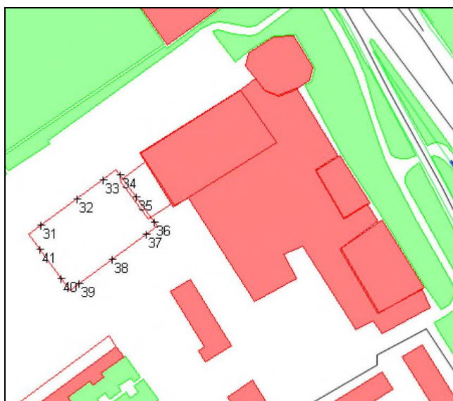
Figuur 1 Situatie en locatie waarneempunten school