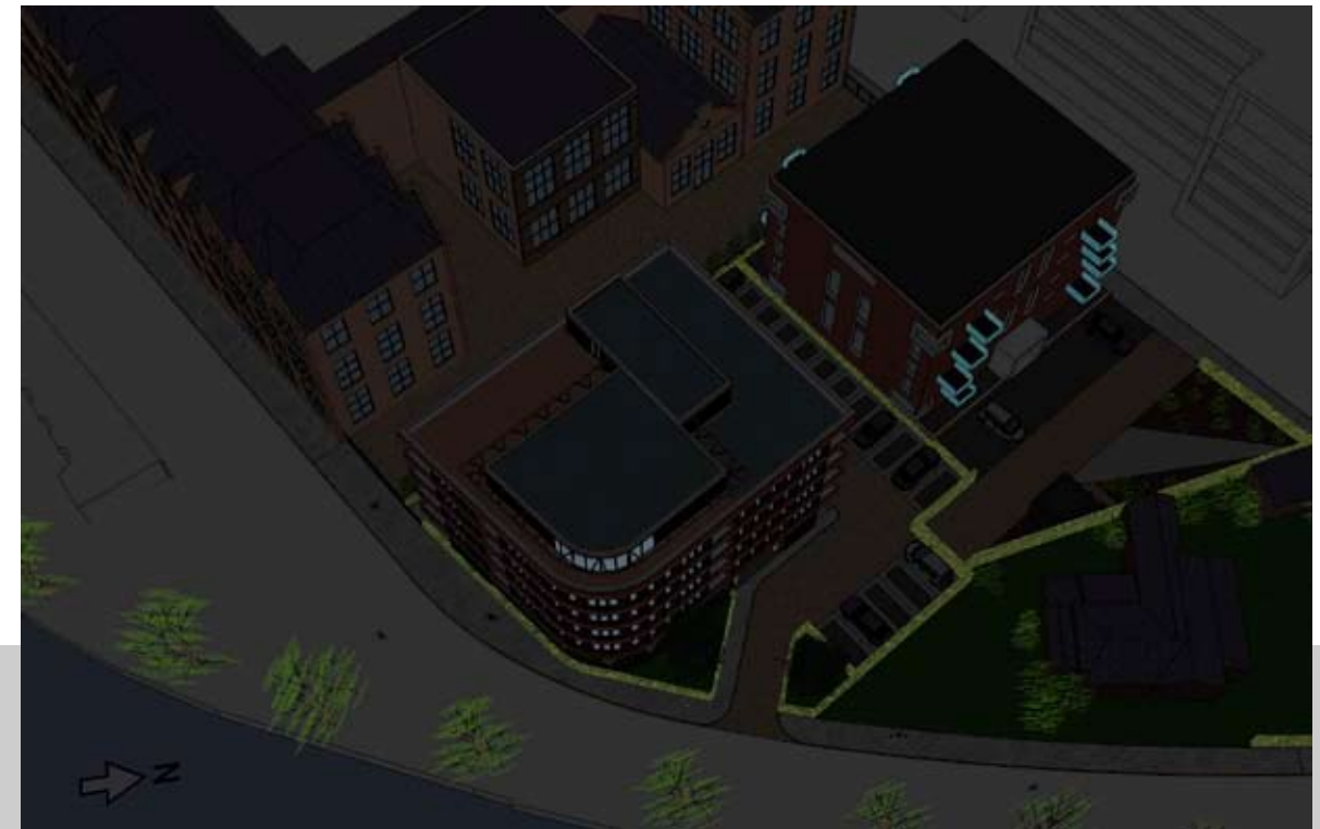
20.00 UUR - NIEUW