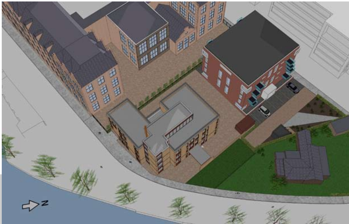
20.00 UUR - BESTAAND