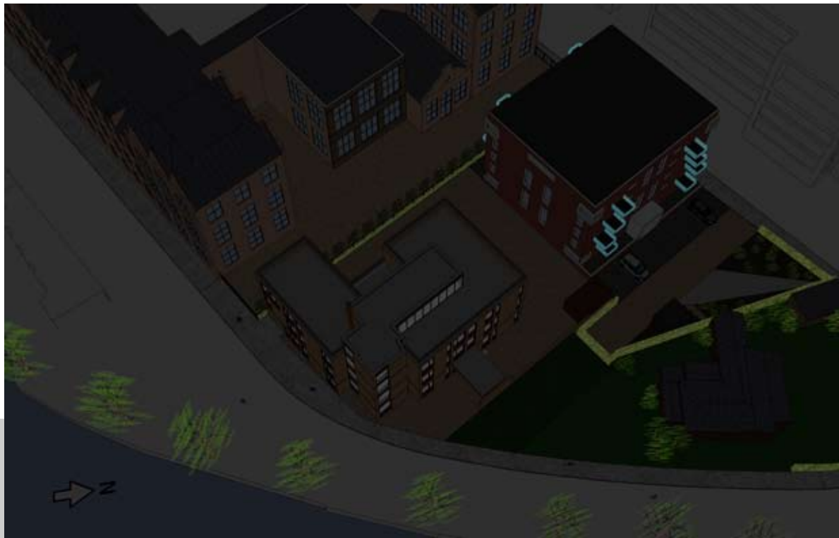
20.00 UUR - BESTAAND