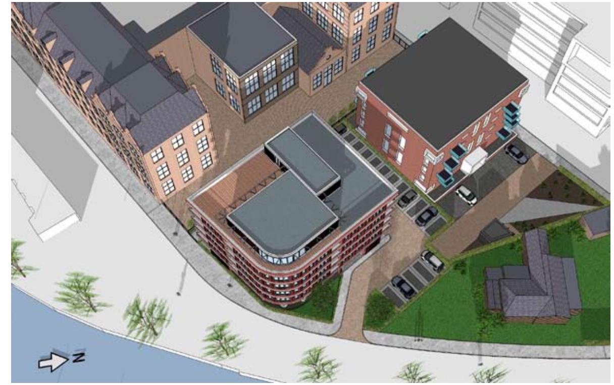
08.00 UUR - NIEUW