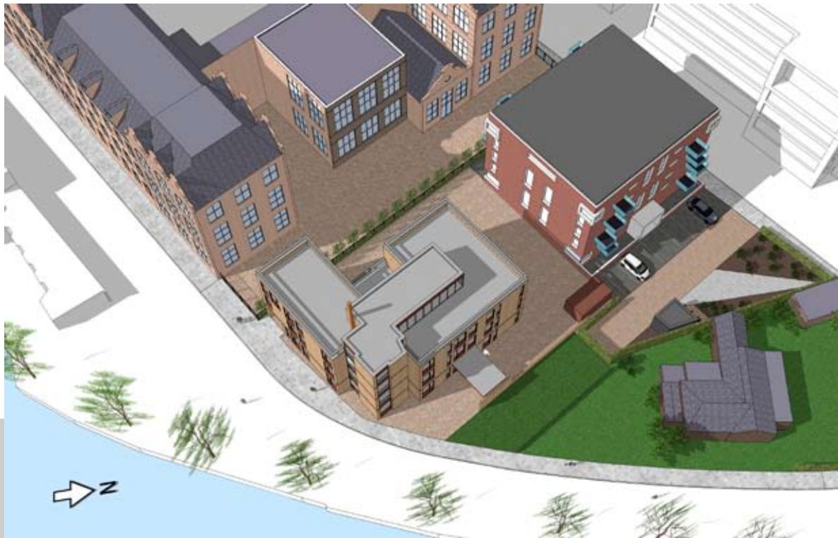
12.00 UUR - BESTAAND