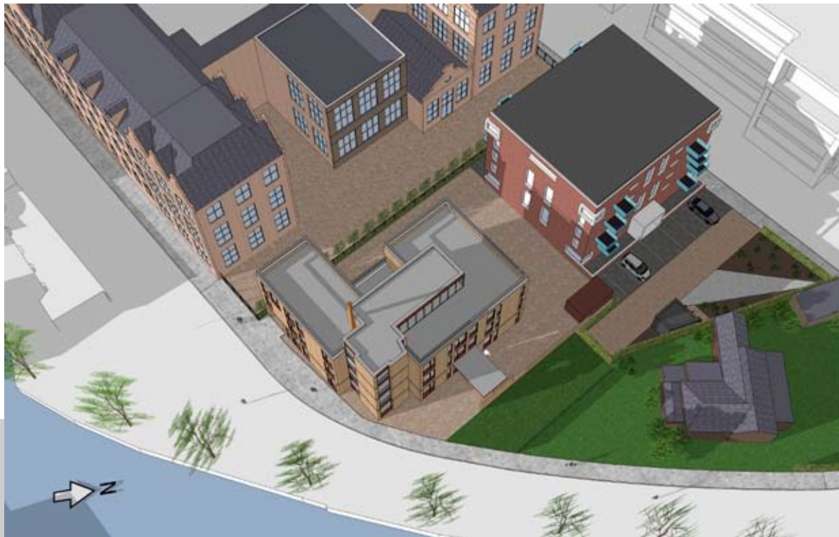
12.00 UUR - BESTAAND