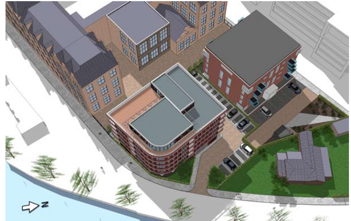
16.00 UUR - NIEUW