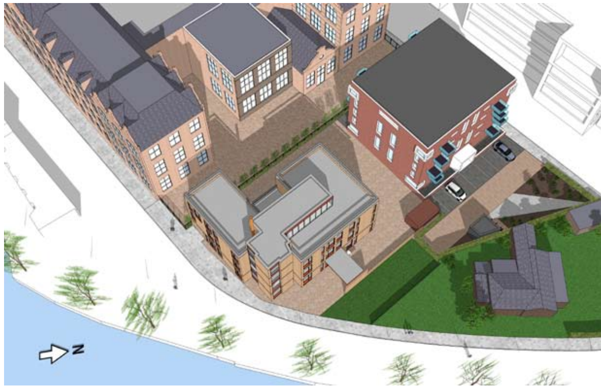
08.00 UUR - BESTAAND