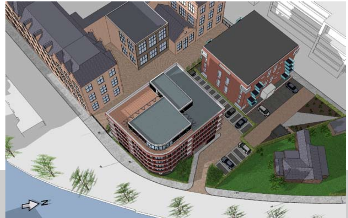
12.00 UUR - NIEUW