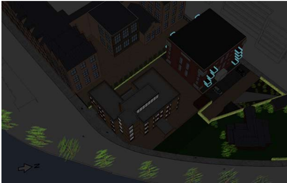
08.00 UUR - BESTAAND