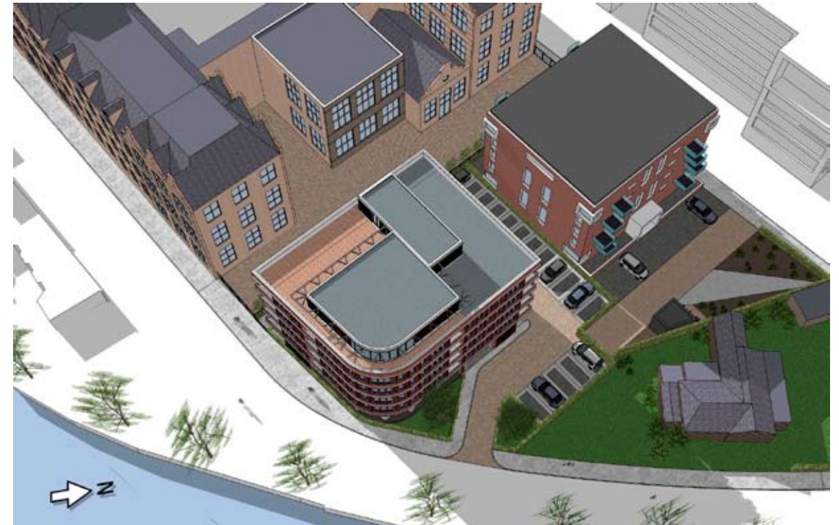
16.00 UUR - NIEUW