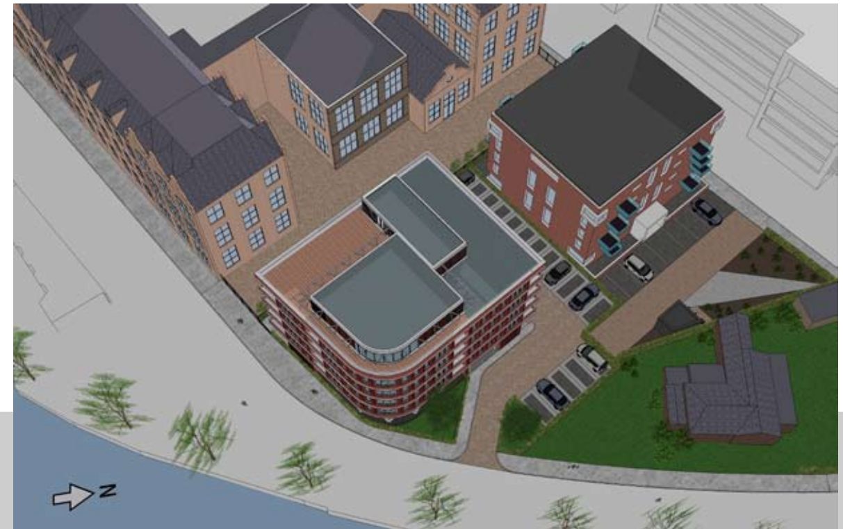
20.00 UUR - NIEUW