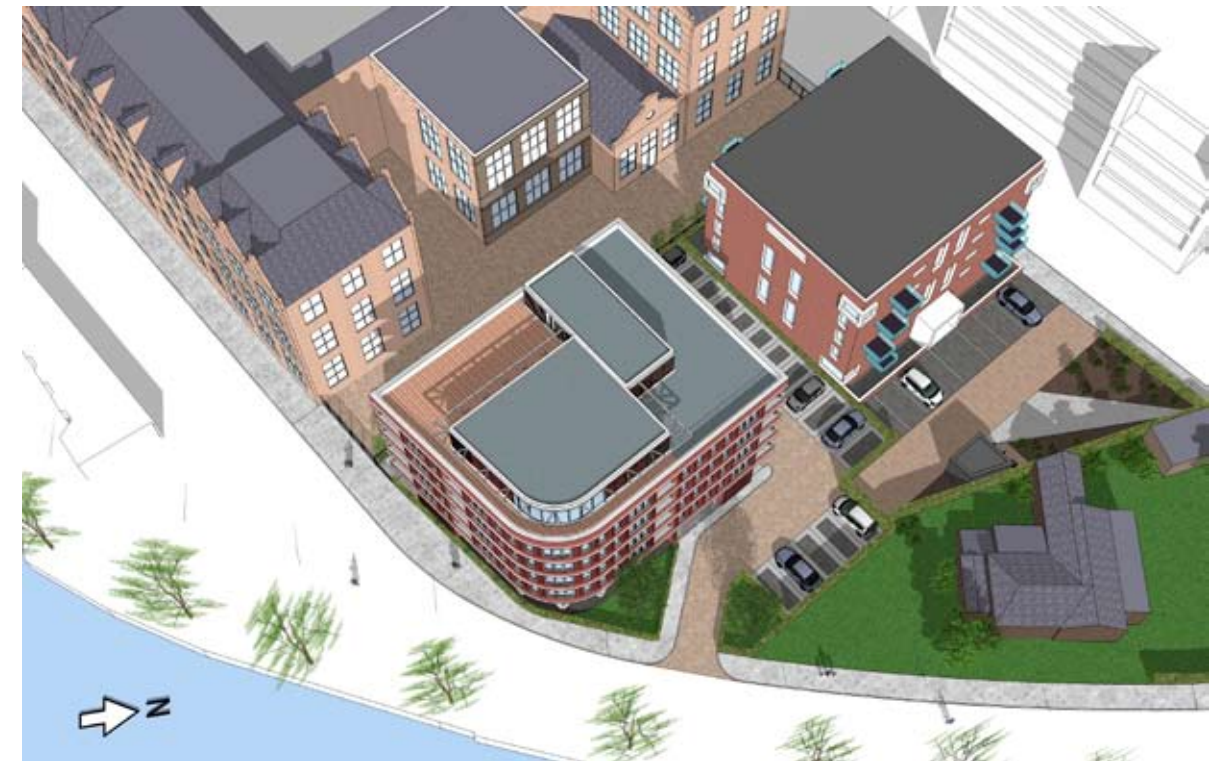
08.00 UUR - NIEUW