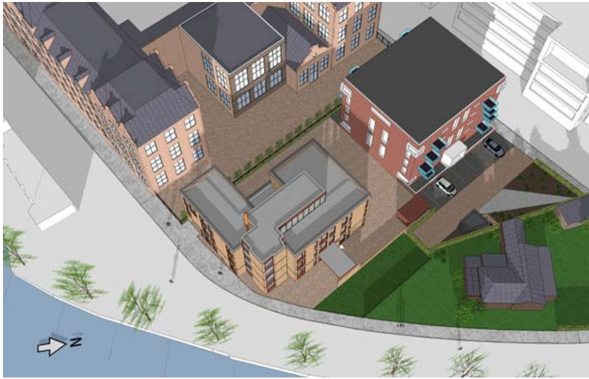
08.00 UUR - BESTAAND