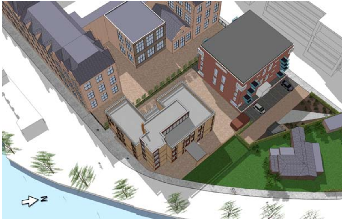
16.00 UUR - BESTAAND