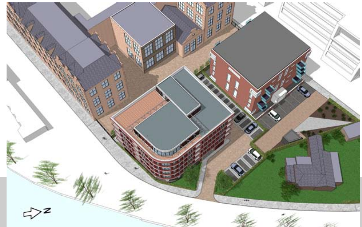
12.00 UUR - NIEUW