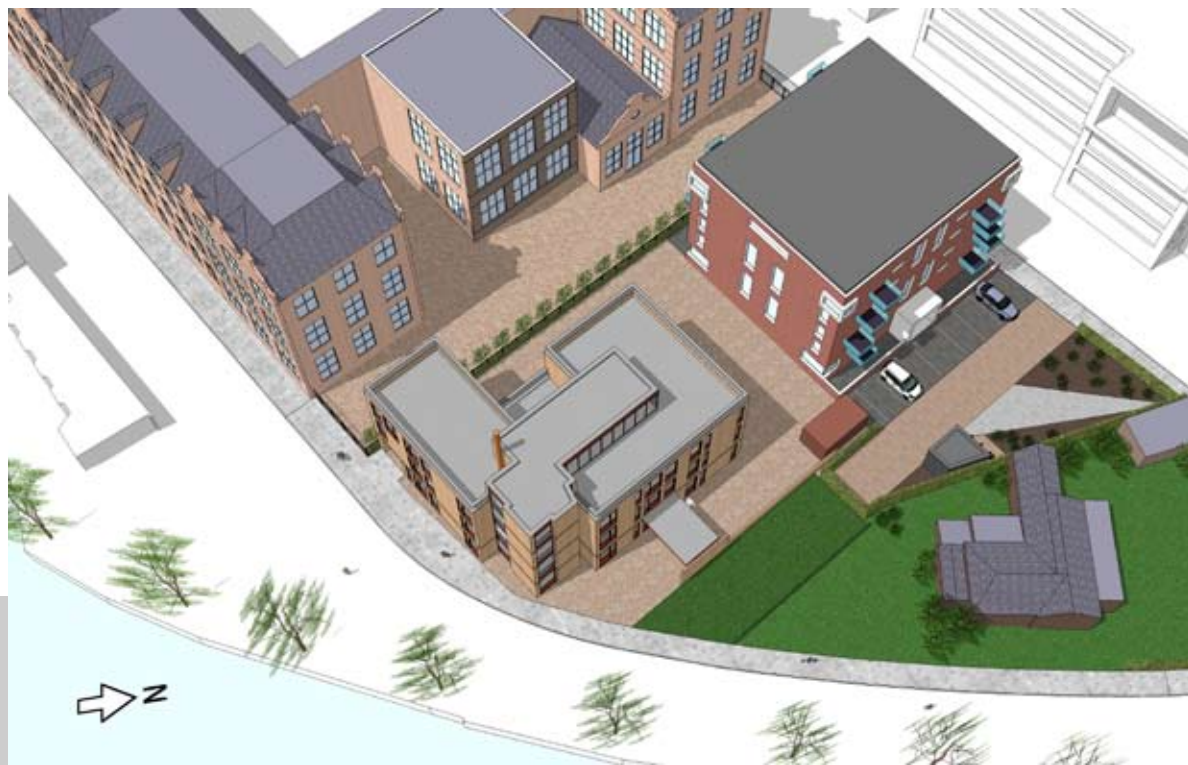
12.00 UUR - BESTAAND