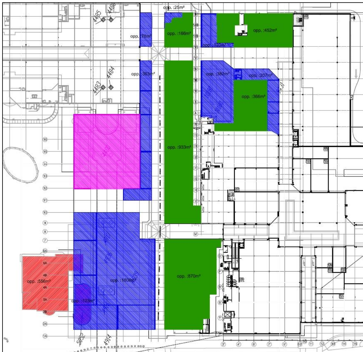
Figuur 9. De voorgenomen herontwikkeling op de onderzoekslocatie met te verwijderen bebouwing (rood), te behouden winkels (groen), te ontwikkelen winkels (blauw) en nieuw te bouwen RET gebouw (roze).

De initiatiefnemer is voornemens de onderzoekslocatie te herontwikkelen. Hierbij worden de twee gebouwen op het plein gesloopt. De winkels en appartementencomplexen blijven behouden. Op de locatie worden nieuwe gebouwen en winkels gerealiseerd. Een deel van de nieuwe bebouwing zal worden gerealiseerd tussen de huidige winkels en appartementencomplexen. Voor de herontwikkeling zie figuur 9.