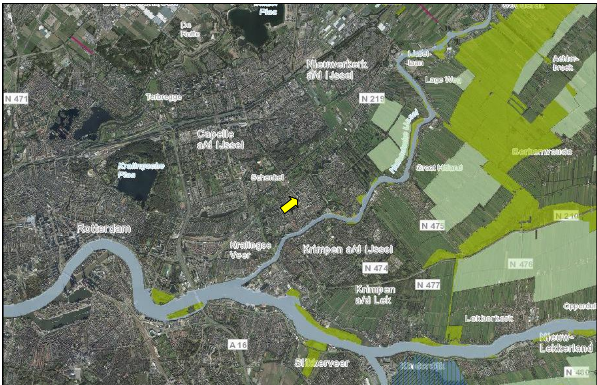
Figuur 10. Ligging onderzoekslocatie ten opzichte van landgebieden van het Natuurnetwerk Nederland (groen), watergebieden van het Natuurnetwerk Nederland (blauw), ecologische verbindingen (roze), Natura 2000 (blauw gearceerd) en belangrijke weidevogelgebieden (lichtgroen).