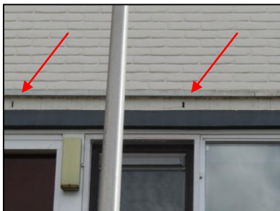
Figuur 11. Geschiedte openingen in het oostelijk gelegen appartementencomplex.

De appartementencomplexen en het gebouw op het zuidwestelijke deel van de onderzoekslocatie zijn in principe geschikt als verblijfplaats voor vleermuizen, vanwege de aanwezigheid van geschikte openingen die toegang verlenen tot de spouwmuren (zie figuur 11 en 12). Tevens zijn er op verscheidene plekken ruimtes achter betimmeringen waargenomen waar vleermuizen gebruik van kunnen maken (zie figuur 13). De bebouwing is geschikt als verblijfplaats voor gewone dwergvleermuis en laatvlieger. Deze soorten kunnen de bebouwing in principe gebruiken als zomerverblijf, kraamverblijf en als paarverblijf (zie hoofdstuk 6).