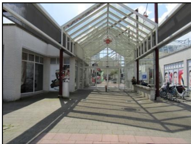
Figuur 3. Oostelijke ingang winkelstraat.