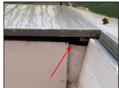
Figuur 13. Ruimte achter betimmering van het zuidwestelijk gelegen gebouw op het plein.