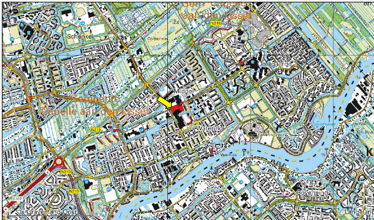
Figuur 1. Topografische ligging van de onderzoekslocatie.

Volgens de topografische kaart van Nederland, kaartblad 38 A (schaal 1:25.000), zijn de coördinaten van het midden van de onderzoekslocatie X = 100.100 , Y = 438.365 .