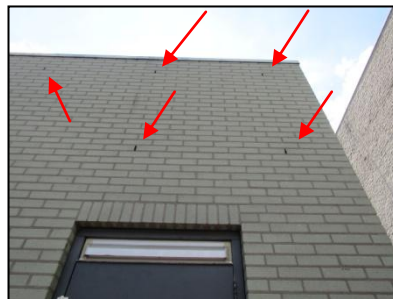
Figuur 12. Geschiedte openingen in het gebouw op het zuidwestelijke deel van de onderzoekslocatie.