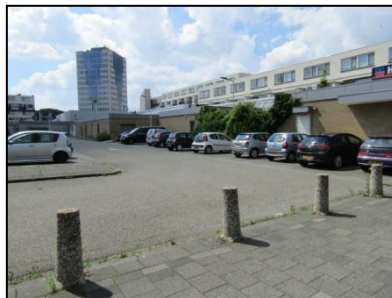
Figuur 4. De zuidoostelijke grens van de onderzoekslocatie.