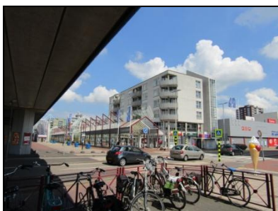
Figuur 6. Overzicht van de onderzoekslocatie vanaf de westelijke hoek.