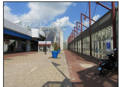
Figuur 5. Overzichtsfoto van het metrostation en de winkelstraat.