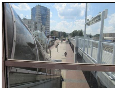
Figuur 7. Overzichtsfoto vanaf het metrostation.