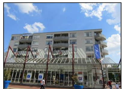
Figuur 8. Winkelstraat en een van de twee appartementencomplexen.