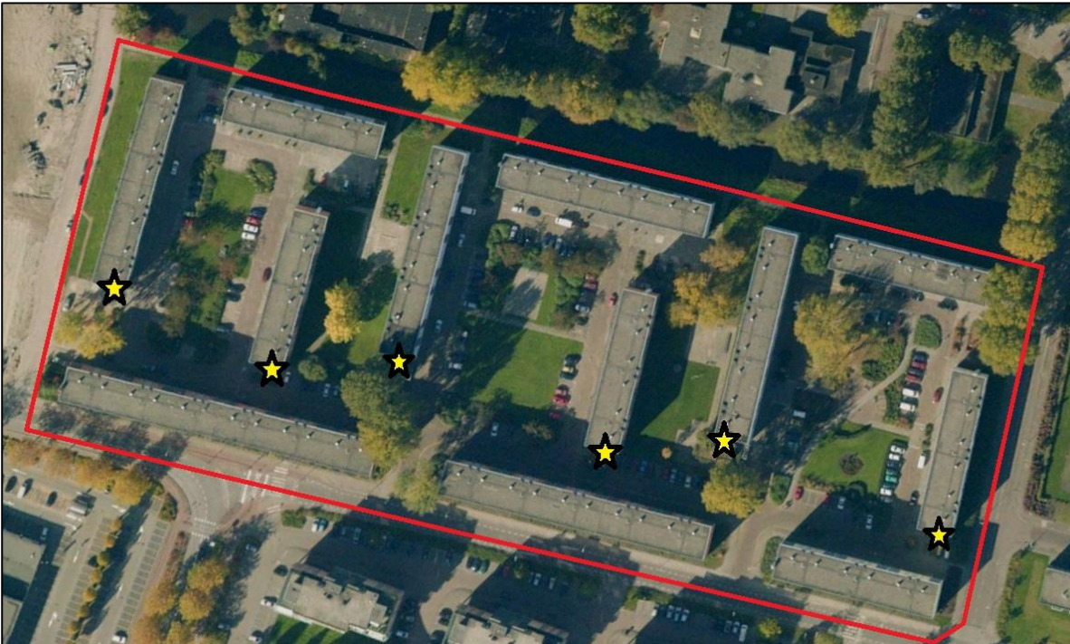
Figuur 3. De gele sterren duiden de locaties van zes paarverblijven van Ruige dwergvleermuizen aan in het onderzoeksgebied.

Zowel de Gewone dwergvleermuis als de Ruige dwergvleermuis zijn algemene vleermuissoorten in dit deel van Nederland (Broekhuizen et al. 2016).