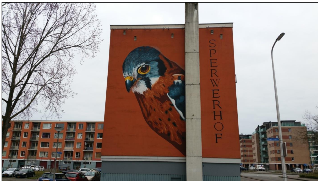
Figuur 2. De vleermuiskasten op de flats van De Hoven in Capelle aan den IJssel zijn duidelijk zichtbaar. Sommige kasten (zoals die op deze foto) worden 's-nachts beschenen door spotlights. Hierdoor bleven deze kasten onbewoond.