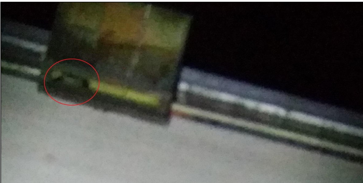
Figuur 4. De onderzijde van een vleermuiskast. Rood omcirkeld een mannetje Ruige dwergvleermuis in zijn paarverblijfplaats in De Hoven, Capelle aan den IJssel (31 augustus 2016).