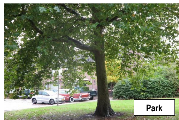
Figuur 2. Aanzicht van het plangebied van de inbreidingslocatie te Zwartewaal.