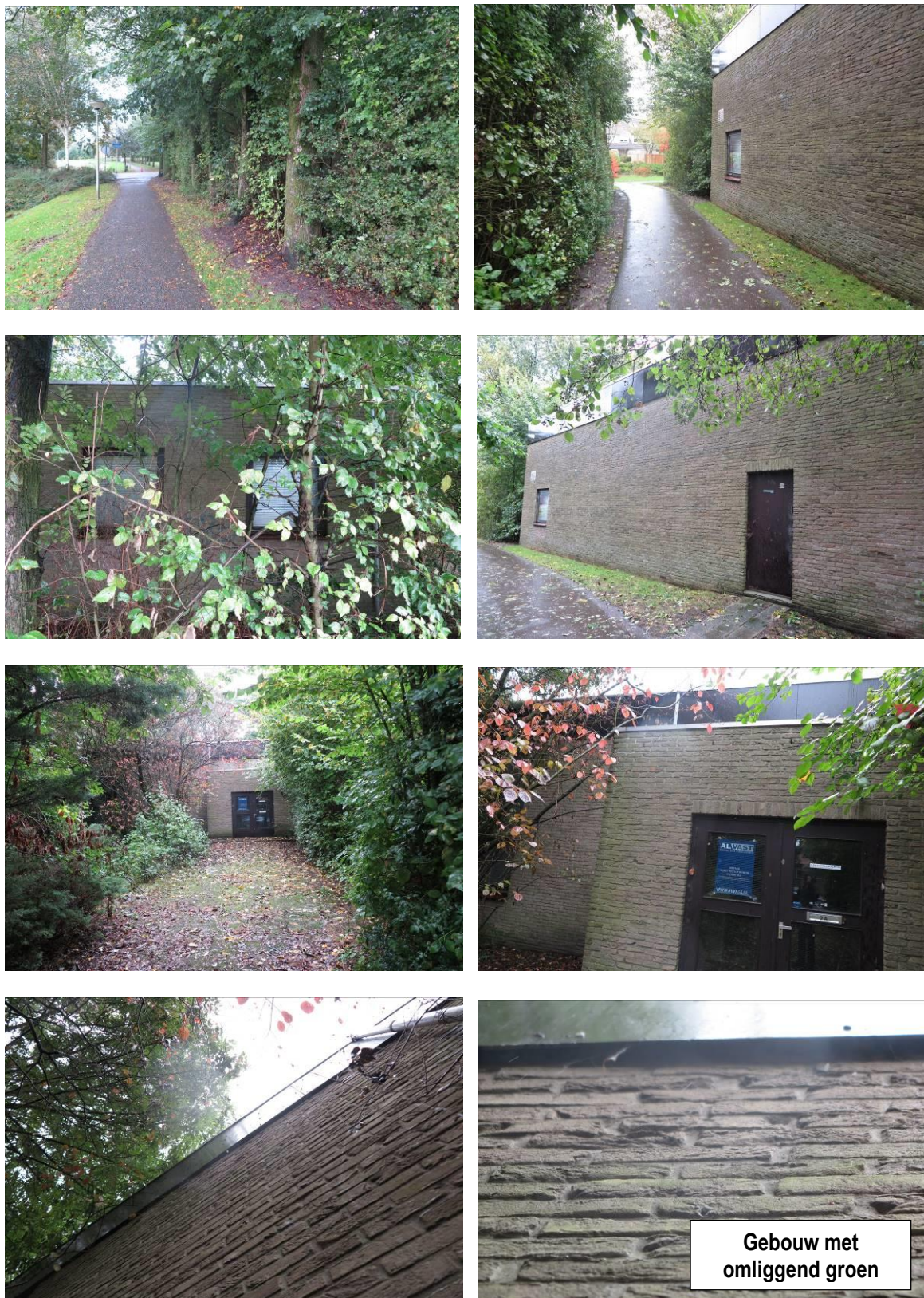
Vervolg figuur 2. Aanzicht van het plangebied van de inbreidingslocatie te Zwartewaal.