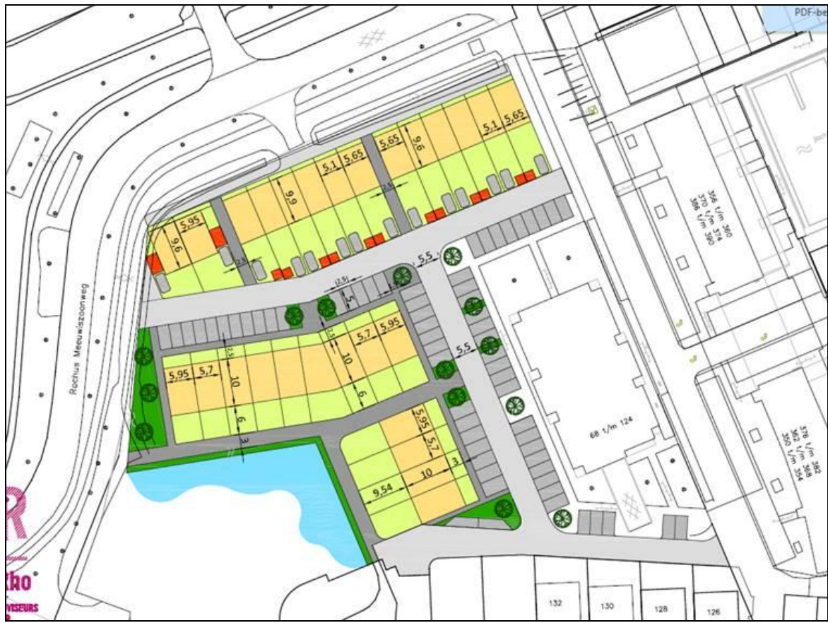
Figuur 3. Plansituatie Waterfront te Brielle.