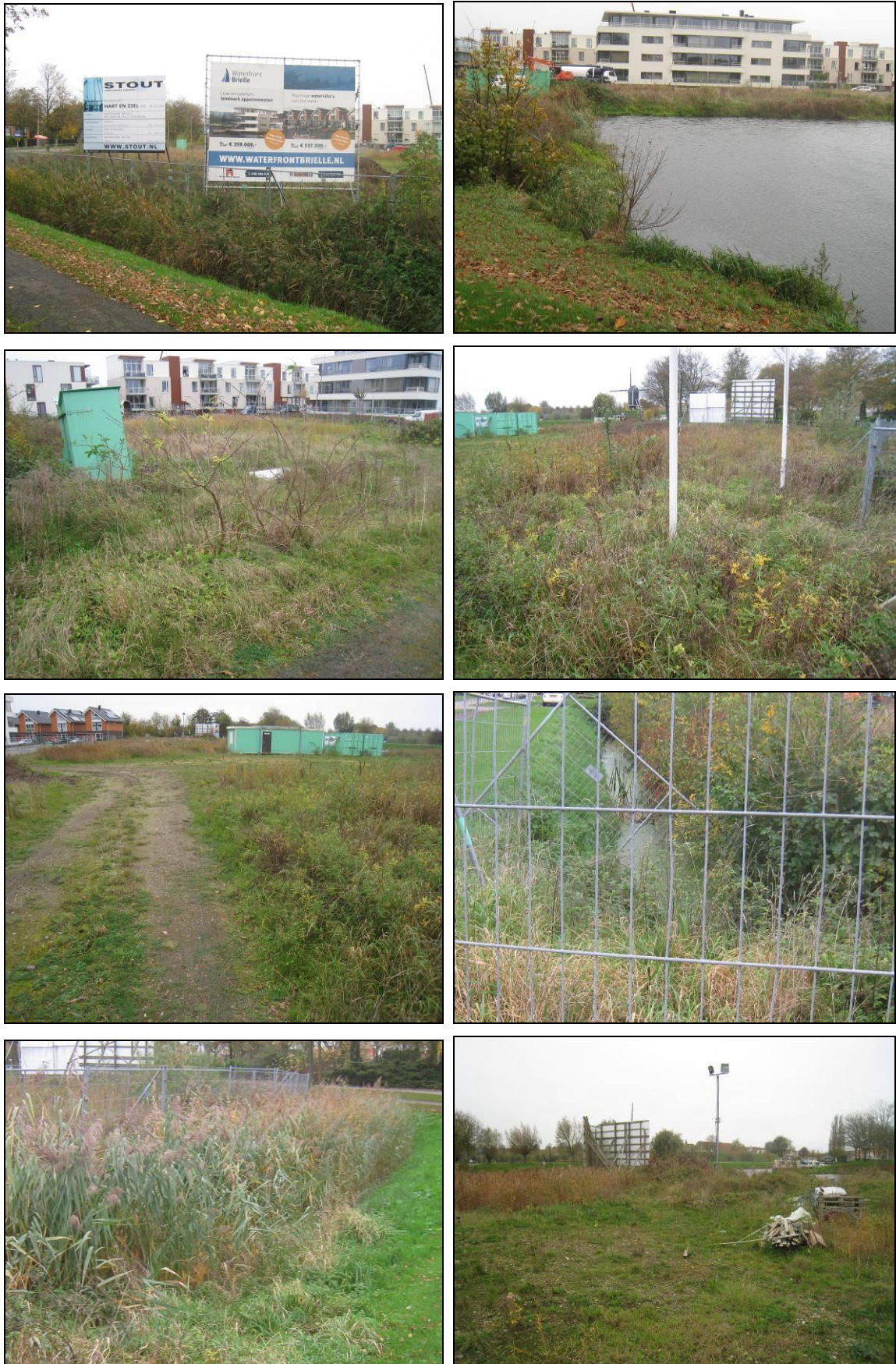
Figuur 2. Aanzicht van het plangebied Waterfront te Brielle.