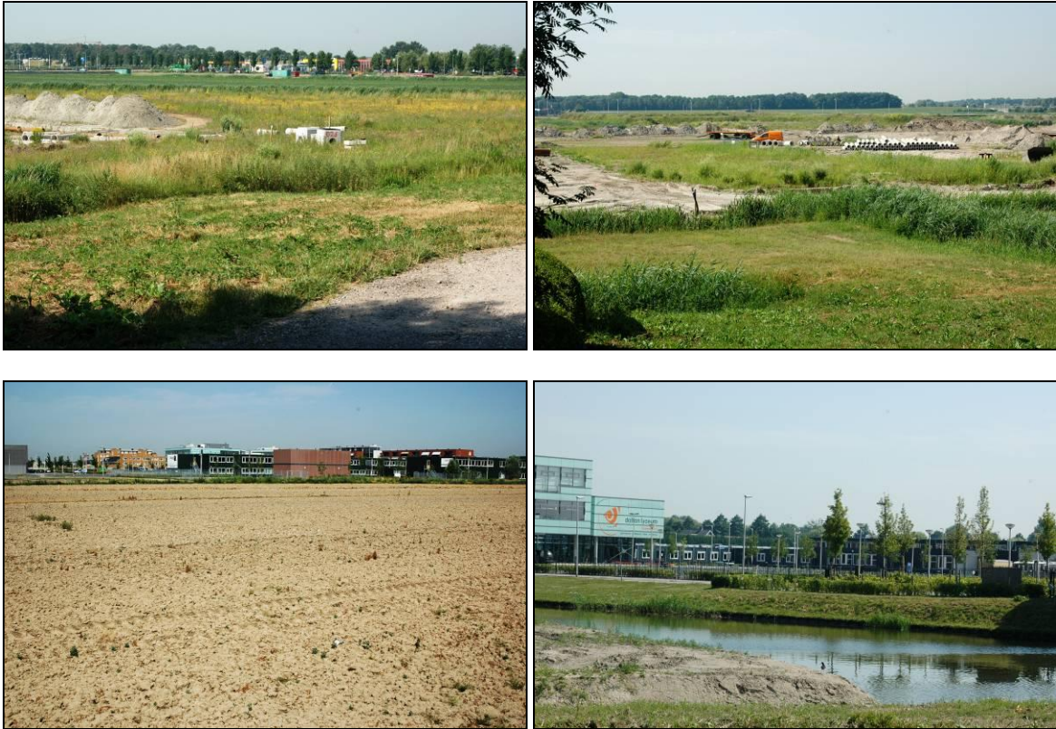
Figuur 2. foto-impresie gegeven van het plangebied van nieuwbouwgebied Lagewei Vrouwenpolder te Barendrecht.