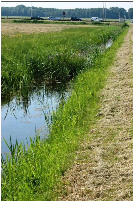
Figuur 3. Belangrijke vangstlocatie van kleine modderkruiper.

In de oostelijke sloot parallel aan de Middelweg komt kleine modderkruiper in hoge dichtheid voor (zie figuur 3 voor een beeld van deze sloot). In enkele wateren werden daarnaast kleine modderkruipers in lage dichtheid vastgesteld. Er werden enkele vangsten verricht. De kleine modderkruiper is matig beschermd en niet bedreigd.