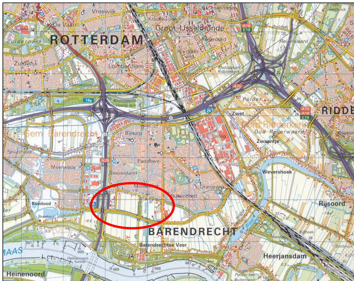
Figuur 1. Globale ligging van nieuwbouwwijk Lagewei Vrouwenpolder te Barendrecht.

Het plangebied is gelegen ten zuiden van Barendrecht. In figuur 1 wordt de ligging weergegeven en in bijlage 1 wordt de exacte begrenzing weergegeven. In figuur 2 wordt een foto-impressie gegeven van het plangebied.