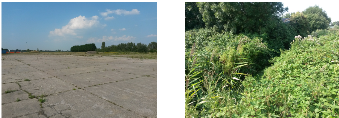
Figuur 2 Overzicht plangebied (links) en overwoekerde sloot met stukje loods (rechts)