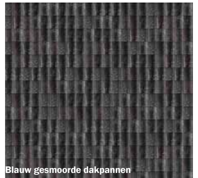
Blauw gesmoorde dakpannen