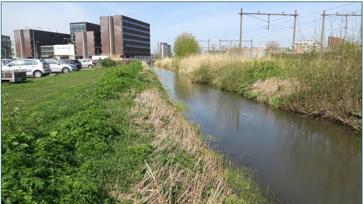
Figuur 4 De watergang welke aan de oostzijde grenst aan de planlocatie.