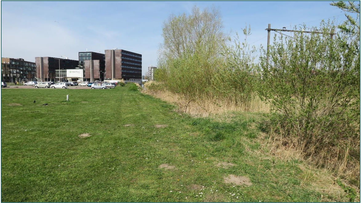
Figuur 3 De groenstrook aan de oostzijde van de planlocatie.