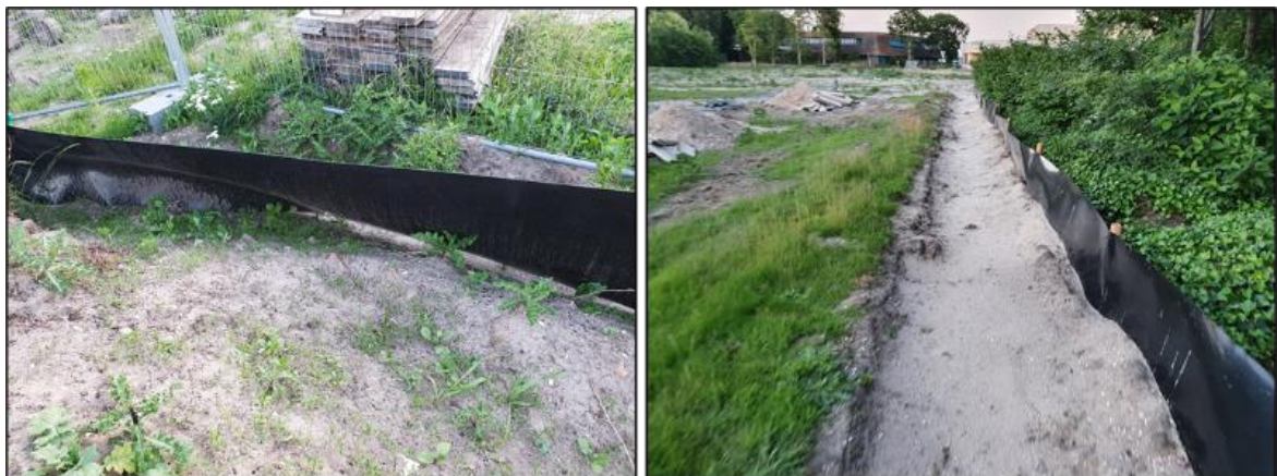
Figuur 3 Een incorrect geplaatst amfibiescherm (links). Een correct geplaatst amfibiescherm (rechts). Deze dienen minimaal 10 cm ingegraven te zijn.

In de najaar- en winterperiode moet gezorgd worden dat er geen overwintering van rugstreeppadden kan optreden. Voldoende vergraafbaar zand (zanddepot) kan gebruikt worden voor overwintering. Ook stenenstapels, houtstapels of andere vorstvrije structuren (onder een bouwkeet bijvoorbeeld) kunnen gebruikt worden voor overwintering. Dergelijke structuren dienen weggehaald te worden buiten de overwinteringsperiode (september-april) van de soort. Het ontoegankelijk houden van het plangebied voor rugstreeppadden houdt in dat voorzieningen worden geplaatst waardoor rugstreeppadden het plangebied niet kunnen bereiken. Dit kan bijvoorbeeld door het plaatsen van schermen van stevig plastic of worteldoek van 50 centimeter hoog en minimaal 10 centimeter ingegraven in de grond (figuur 3). De voorzieningen die getroffen zijn om het gebied ontoegankelijk te maken moeten zodanig geplaatst en beheerd worden dat ze hun functie ten allen tijden kunnen vervullen.