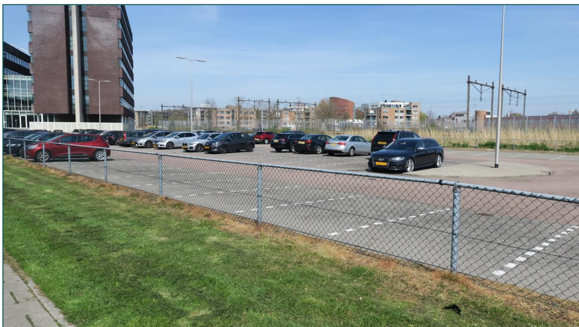
Figuur 1 De planlocatie is gelegen aan de Noordpoolsingel ong. te Alphen aan den Rijn.