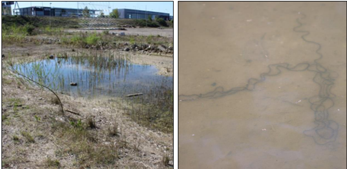
Figuur 2 Bij hevige regenval kunnen ondiepe plassen gevuld worden met water. Deze tijdelijke poelen zijn uitermate geschikt voor de rugstreeppad, waarin eisnoeren afgezet kunnen worden. Het ontstaan van deze geulen dient te allen tijde voorkomen te worden.

In de najaar- en winterperiode moet gezorgd worden dat er geen overwintering van rugstreeppadden kan optreden. Voldoende vergraafbaar zand (zanddepot) kan gebruikt worden voor overwintering. Ook stenenstapels, houtstapels of andere vorstvrije structuren (onder een bouwkeet bijvoorbeeld) kunnen gebruikt worden voor overwintering. Dergelijke structuren dienen weggehaald te worden buiten de overwinteringsperiode (september-april) van de soort. Het ontoegankelijk houden van het plangebied voor rugstreeppadden houdt in dat voorzieningen worden geplaatst waardoor rugstreeppadden het plangebied niet kunnen bereiken. Dit kan bijvoorbeeld door het plaatsen van schermen van stevig plastic of worteldoek van 50 centimeter hoog en minimaal 10 centimeter ingegraven in de grond (figuur 3). De voorzieningen die getroffen zijn om het gebied ontoegankelijk te maken moeten zodanig geplaatst en beheerd worden dat ze hun functie ten allen tijden kunnen vervullen.