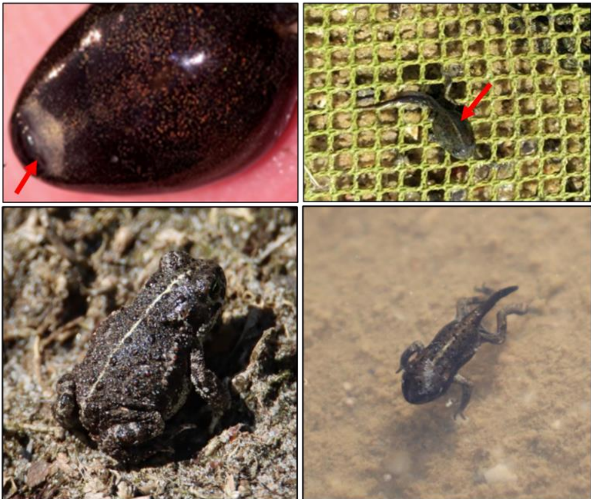
Figuur 1 Impressies van de verschillende levensstadia van rugstreepad.

De rugstreepad ( Epidalea calamita ) is een middelgrote pad met een lengte van circa 4,5 - 7 cm. De pad heeft vrij korte poten en heeft op de rug een karakteristieke lichtgele lengtestreep. Verder is de rug grijsbruin met groenige vlekken en heeft de buik een lichtgrijze kleur met grijszwarte vlekken. De ogen zijn geelgroen en hebben een horizontale pupil. Mannetjes zijn in de paartijd te onderscheiden van vrouwtjes door een paars/blauwe verkleuring van de keel. Gedurende het voortplantingsseizoen is tijdens de kooractiviteiten een typische en harde roep te horen die over een afstand van 1 - 3 km is waar te nemen (Creemers & Van Delft, 2009). De larven van rugstreepad zijn maximaal 2,5 cm lang en zwart van kleur. Oudere larven hebben een lichte keelvlek en soms een streep over de rug (figuur 1, Diepenbeek & Creemers, 2006).