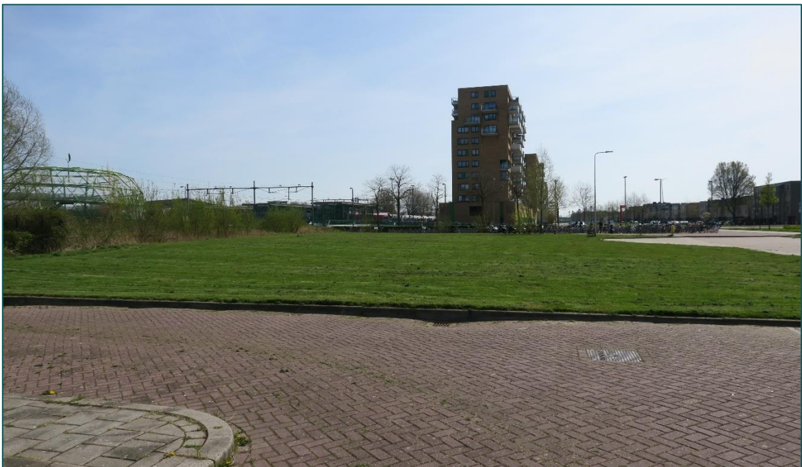
Figuur 1.1 De planlocatie is gelegen aan de Noordpoolsingel ong. te Alphen aan den Rijn.