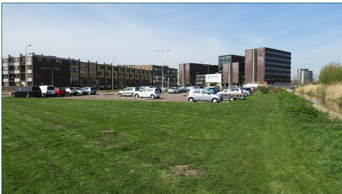
Figuur 2 De planlocatie bestaat uit parkeerplaatsen en een grasperceel.