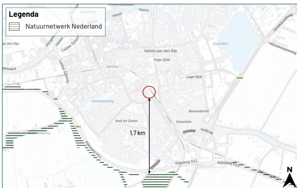
Figuur 3.2 De planlocatie ligt op een afstand van circa 1,7 km tot het Natuurnetwerk Nederland ( ruimtelijkeplannenzuidholland.nl ).

De planlocatie maakt geen deel uit van een beschermd gebied betreffende beschermingscategorie 1 (Natuurnetwerk Nederland en beschermd grasland in de Bollenstreek) of beschermingscategorie 2 (Belangrijk weidevogelgebied en Groene buffer). Op een afstand van circa 1,7 km ligt het Natuurnetwerk Nederland (figuur 3.2). Op een afstand van circa 12,5 km ligt beschermd grasland in de Bollenstreek (geen kaartweergave). Op een afstand van circa 1,7 km ligt Belangrijk weidevogelgebied en op een afstand van circa 4,9 km ligt de Groene buffer (geen kaartweergave). Er zijn geen karakteristieke landschapselementen aanwezig op de planlocatie die weggenomen worden ten gevolge van de beoogde ingreep. Ten aanzien van provinciaal aangewezen gebieden geldt dat externe werking geen toetsingskader is.