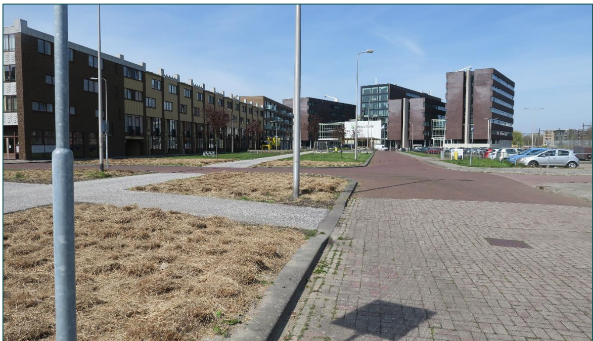
Figuur 1.3 Fotografische indruk van de omgeving van de planlocatie.

De directe omgeving van de planlocatie wordt gekenmerkt door woningen, infrastructuur en gemeentelijk groen. Direct aan de oostzijde van de planlocatie ligt een watergang. Op een afstand van circa 15 m ten oosten van de planlocatie ligt een spoorweg. Op een afstand van circa 470 m ten oosten van de planlocatie stroomt de 'Oude Rijn'.