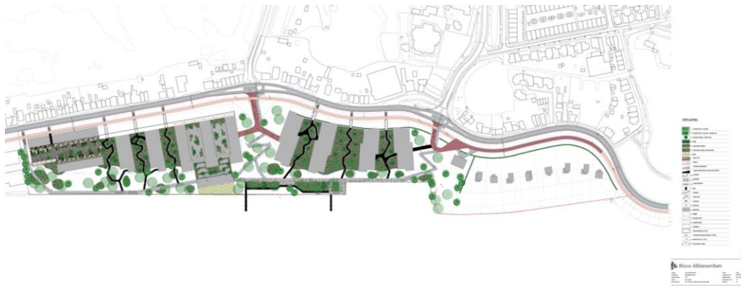
Afbeelding 1.1: concept stedenbouwkundig plan (bron: stedenbouwkundig plan Bosch Schlabbers landschapsarchitecten, d.d. 10 november 2020)

Thans wordt toegewerkt naar een ontwerpbestemmingsplan.