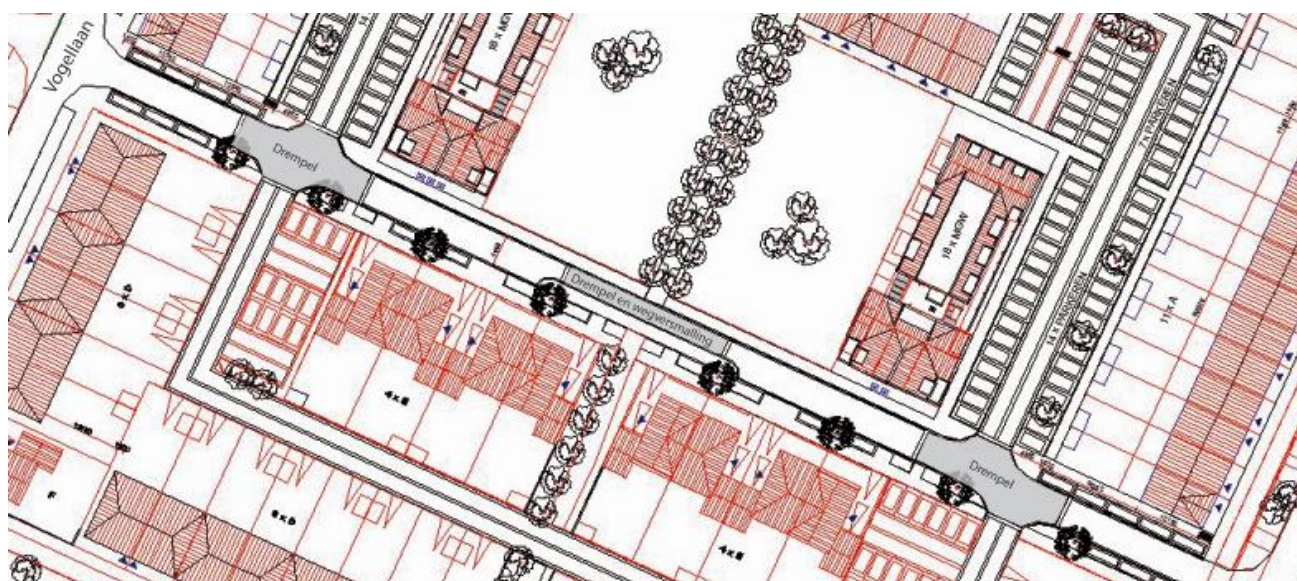
Afbeelding 2 Verkeersmaatregelen

In het plan is parkeren zoveel mogelijk uit het zicht van de woningen gehouden. In de buitenring wordt parkeren achter de woningen opgelost. Alle overige parkeerplaatsen bevinden zich aan de binnenstraat. In deze straat zijn dan ook auto's te 'gast'. Parkeren zal geschieden op eigen erf en op informele wijze op speciaal ontworpen parkeer-/speelpleinen.