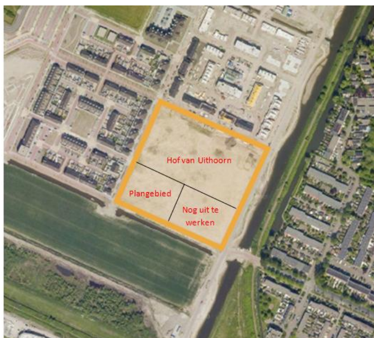
Afbeelding 1 Ligging plangebied

Met onderhavig plan wordt een tweede fase van deelgebied 3 uitgewerkt.