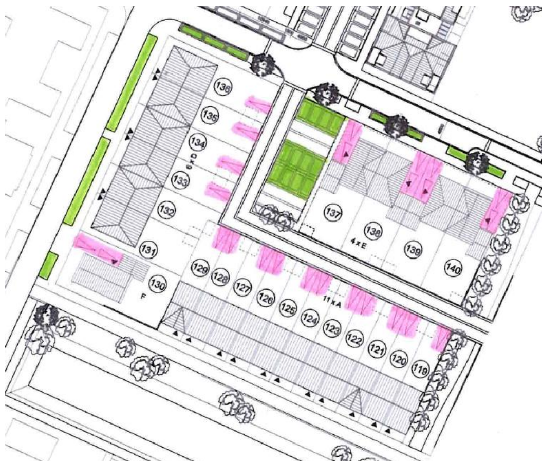
Afbeelding 3 Ligging parkeerplaatsen

Het plangebied voorziet in 37 parkeerplaatsen. Hiermee voldoet het plan aan de parkeernorm van de gemeente Uithoorn. Op de afbeelding hieronder is de ligging van de parkeerplaatsen weergegeven. In het groen de openbare parkeerplaatsen en in het roze de parkeerplaatsen op eigen terrein.