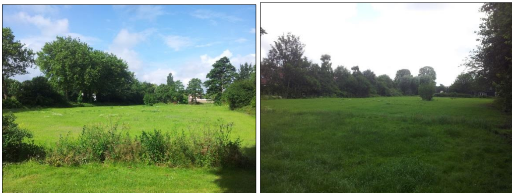
Locatie Doorbraak 9 (links) en Doorbraak 11 en 13 (rechts)

Ten behoeve van de actualisatie zijn foto's genomen en beoordeeld van de huidige situatie. Alle bebouwing in het plangebied is gesloopt en het gebied is ingezaaid met gras. Of met de sloop van de peuterspeelzaal en brandweerkazerne verblijfplaatsen van vleermuizen verloren zijn gegaan is niet te achterhalen. Het opgaand groen rond het plangebied is grotendeels behouden gebleven.