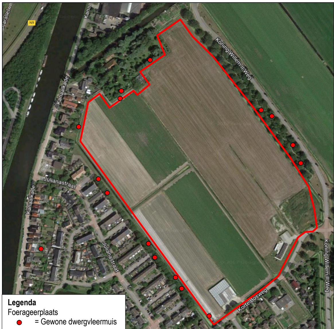
Figuur 2. Waarnemingen van vleermuizen in de voorzomer ter plaatse van en rond woningbouw 't Zand te Schagen.

In de voorzomer is één vleermuissoort waargenomen (gewone dwergvleermuis). Deze soort is vliegend en foeragerend aangetroffen. Er zijn geen kolonies of vliegroutes aangetroffen. De gewone dwergvleermuis komt in lage dichtheid voor en in relatief hoge aantallen rond de boomstructuren. In figuur 2 staan de waarnemingen weergegeven.