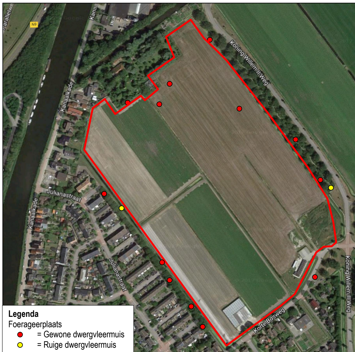
Figuur 3. Waarnemingen van vleermuizen in de voorherfst plaatse van en rond woningbouw 't Zand te Schagen.

Er zijn in de voorherfst gewone- en ruige dwergvleermuizen vliegend en foeragerend aangetroffen. Er zijn geen balts- of paarplaatsen vastgesteld ter plaatse van of direct rond het plangebied. In figuur 3 worden de waarnemingen weergegeven.